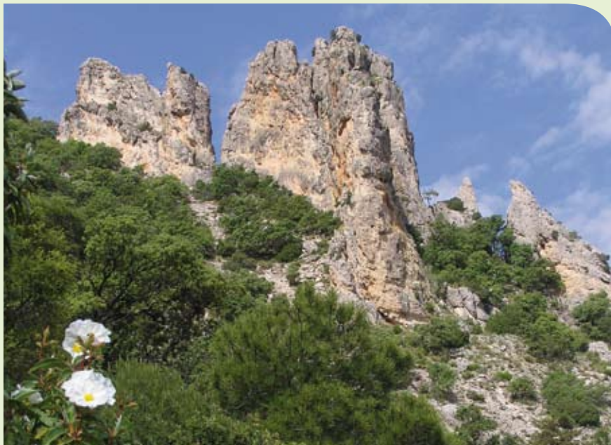
Los Frailejones de Mojantes.

Las especies de flora de interés comunitario quedan definidas en la Directiva 92/43/CEE, como aquellas en peligro, vulnerables, raras, endémicas y aquellas que estén sujetas a algún tipo de aprovechamiento en el territorio de la Unión Europea.