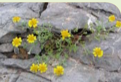
Aspecto de la "manzanilla de Escombreras" ( Anthemis chrysantha ) (J. Moya Ruíz-DGPNB)

La Región de Murcia se encuentra en el ámbito territorial de la Cuenca Mediterránea, un punto caliente de la fitodiversidad mundial. En esta área del planeta se presentan cerca de 25.000 especies de plantas vasculares, cifra que representa algo menos del 10% de la fitodiversidad mundial. En dicho marco se pueden reconocer algunos núcleos de diversidad específica; los más relevantes se encuentran en el Mediterráneo occidental: el complejo del Atlas y Rif, Pirineos y los sistemas béticos. La Región de Murcia presenta una flora vascular compuesta por cerca de 2.000 especies silvestres, naturalizadas, asilvestradas y adventicias, y de 2.400 taxones en la última revisión de la lista patrón de la flora de Murcia. El modelo de distribución generalizado de las especies de la flora murciana es típicamente mediterráneo, aunque los taxones que la diferencian de otros territorios son aquellos con un rango geográfico menor, es decir, el componente endémico. Del total de especies que componen la flora murciana, tan sólo cuatro se indican como exclusivas de la Región de Murcia: Astragalus nitidiflorus , Limonium album , Limonium carthaginense y Teucrium carthaginense . Este número quedaría considerablemente ampliado si analizamos la flora en el rango subespecífico, o si se consideran aquellas especies que pueden tener su óptimo en Murcia.