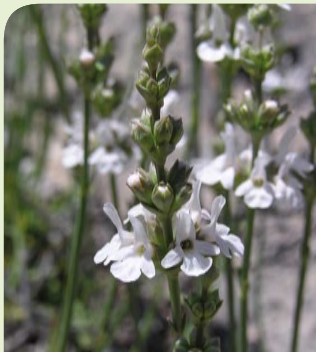
Floración de Sideritis glauca , conocida como "rabogato rosado".

El Catálogo Regional de Flora Silvestre Protegida, aun siendo una aplicación de la Ley básica, presenta su personal idiosincrasia. De una parte, dicho catálogo no contempla especies amenazadas, sino especies que requieran medidas específicas de protección y conservación. De otra, las especies se catalo-