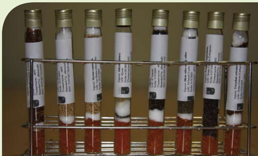
Accesiones del Banco de Germoplasma de la Región de Murcia (F.J. Saorin-DGPNB).

Se ha realizado el vallado de algunas poblaciones para la corrección de diferentes amenazas. En unos casos la presión se estaba realizando por herbívoros silvestres o domésticos ( Cotoneaster granatensis ), pero en otros casos eran determinadas actividades deportivas la causa de la regresión de la población ( Barlia robertiana ). Se han realizado labores de reforzamiento de determinadas poblaciones ( Crataegus laciniata , Sorbus aria , Teucrium campanulatum ) y se han reintroducido con éxito (reintroducciones benignas en el sentido que les da UICN) varias poblaciones de especies protegidas en el marco de los proyectos Genmedoc y Semclimed. Desde las diferentes unidades de gestión del medio natural se han desarrollado proyectos de restauración ambiental y se están diseñando nuevos proyectos entre cuyos objetivos se prioriza la restauración de hábitats, incluyendo las especies murcianas protegidas, destacando la restauración del río Alhárabe o el proyecto Replant, de restauración de zonas incendiadas en la Comarca del Noroeste de Murcia.