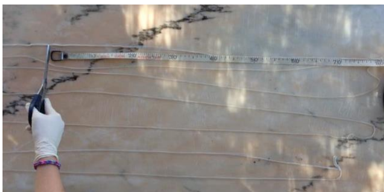
Figura 2: corte de las tripas