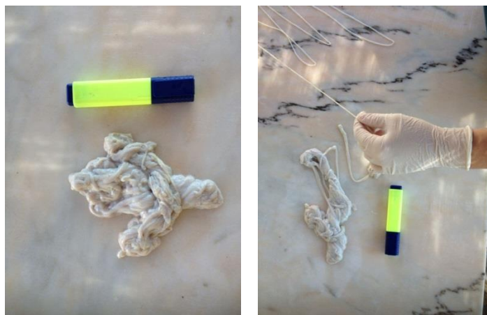
Figura 1: Tripas lavadas y estiradas