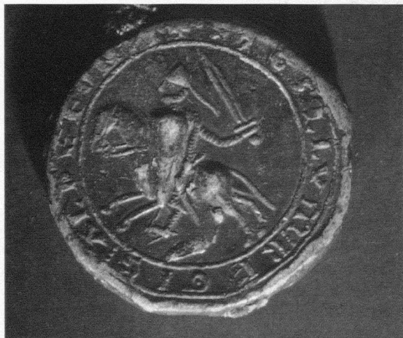
Fig. 2. Sello de Alfonso VIII. Anverso (Archivo Histórico Nacional. Sellos. C 5/1)