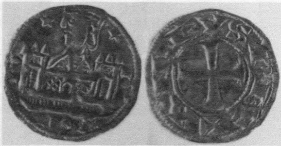
Fig. 4. Moneda de Alfonso VIII (Museo Arqueológico Nacional. N.º Inv.: 4936/20-21)

El cenotafio, de doble caja con tejado a dos aguas, adorna sus laterales y frentes con motivos heráldicos y los cuatro triángulos resultantes en la caja sepulcral con escenas figuradas. En el sepulcro del rey, se cinceló la entrega a doña Misol del documento de fundación y la cruz de las Navas de Tolosa, y en el de la reina, una crucifixión y el tránsito del alma [figuras nº 6 y 7].