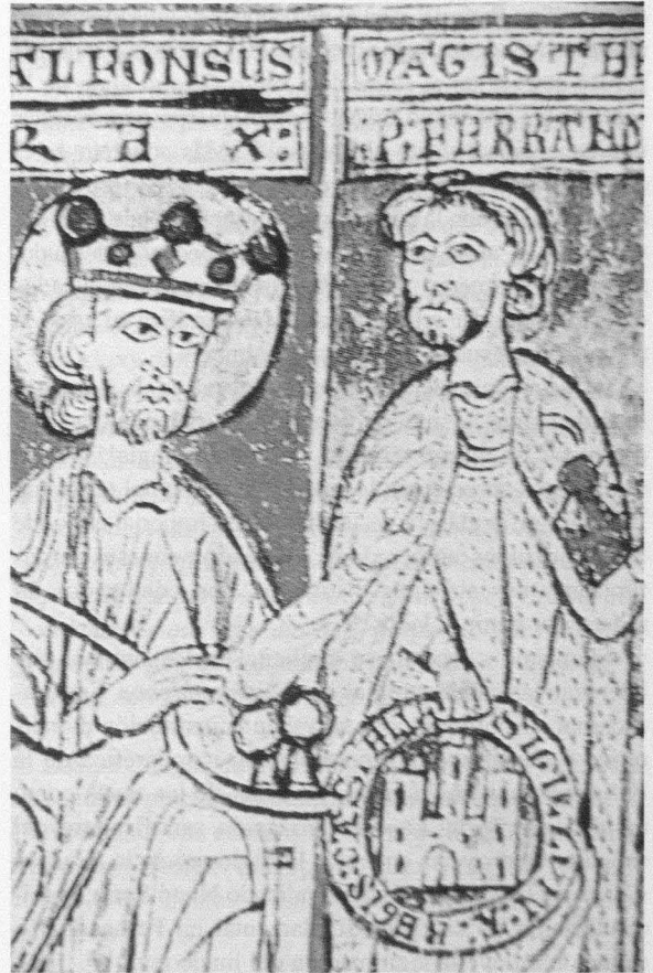
Fig. 9. Donación de la fortaleza de Uclés a la Orden de Santiago por Alfonso VIII y Leonor de Plantagenet. Detalle del sello real (Tumbo Menor de Castilla. Archivo Histórico Nacional. Códices. Sign. 1046 B. Fol. 15r)

Todas las figuras regias exhiben corona. Rada en su De Rebus Hispaniae identifica la traición de Paulo contra el rey visigodo Wamba con la acción de colocarse sobre su cabeza la corona de oro que el muy devoto rey Recaredo había ofrecido... al altar de San Felix 127 y consigna la derrota del traidor en su atavío con una corona de raspa de pescado 128 . El texto del toledano reconoce la corona como el principal distintivo regio y afirma el valor otorgado a su composición material. Miniaturistas y escultores ornaron las cabezas de Alfonso VIII y doña Leonor con coronas. De dispar tipología 129 , a través de botones policromos ( Tumbo Menor ) o del ajedrezado de su base (sepulcro real) se alude a su guarnición con piedras preciosas 130 . Este ornato imbrica la herencia simbólica de las diademas perladas tardoimperiales 131 con el aprecio de la riqueza material como un