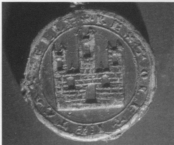
Fig. 3. Sello de Alfonso VIII. Reverso (Archivo Histórico Nacional. Sellos. C 5/1)