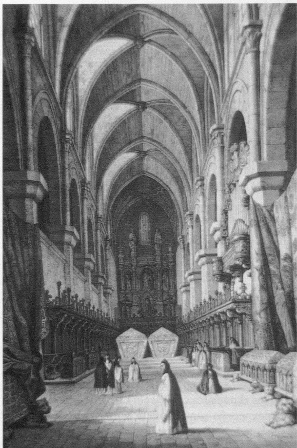
Fig. 1. Interior del coro de las Huelgas de Burgos ( España Artística y Monumental . 1844. Biblioteca Nacional de Madrid)

La nueva disposición debía ser efectiva en 1279, año de la consagración de los altares y cementerios del nuevo templo 91 .