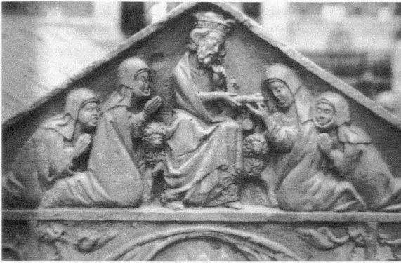
Fig. 8. Sarcófago de Alfonso VIII. Escena de la donación del documento de fundación de las Huelgas (Monasterio Santa María la Real de las Huelgas. Patrimonio Nacional)

hombros que otorgaba majestad y prestancia 122 . En este contexto, resulta apropiado citar unos versos de Gonzalo de Berceo (c. 1196- c. 1252) alusivos a la vestimenta de una talla mariana: Tenié en la cabeza corona muy onrrada/ De suso una impla blanca e muy delgada/ A diestro e a siniestro la tenía bien colgada 123 . Doña Leonor, igual que la Virgen, cubre su impla con una corona.