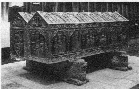
Fig. 7. Sarcófagos de Alfonso VIII y su esposa doña Leonor (Monasterio Santa María la Real de las Huelgas. Patrimonio Nacional)

Por otra parte, diferentes autores han resaltado la excepcionalidad de la fórmula del sepulcro doble exento de Alfonso VIII y Leonor de Plantagenet. No hay precedentes evidentes en esta tipología que reaparecerá con personalidad propia a finales del siglo XV en los cenotafios de Juan II e Isabel de Portugal de la cartuja de Miraflores (Burgos). Significativamente, los dos monumentos tumulares corresponden a los fundadores del cenobio donde