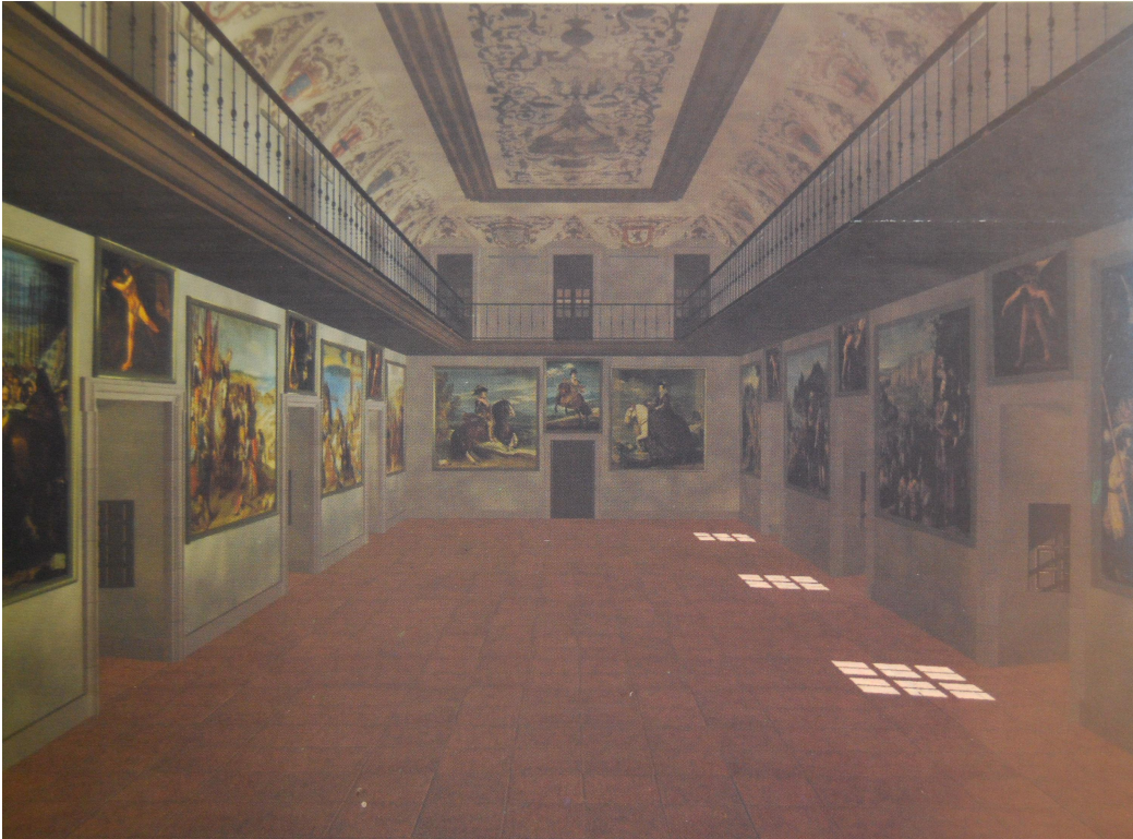
Reconstrucción del salón de Reinos (según Carmen Blasco) 13