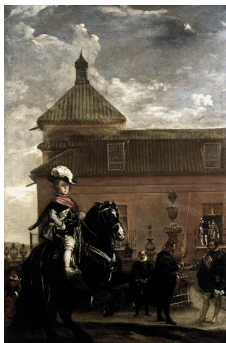
Diego Velázquez, Lección de justar del príncipe Baltasar Carlos , ca. 1636. Colección particular.