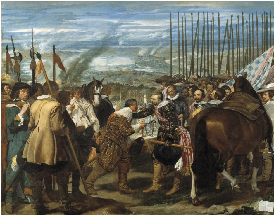
Diego Velázquez, La rendición de Breda , 1634-1635. Museo Nacional del Prado.