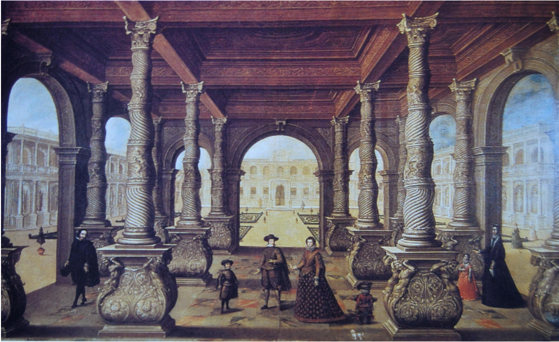
Juan de la Corte, La familia real visita una arquitectura efímera construida en el patio del caballo guiados por el conde-duque de Olivares , 1635-1640. Pollok House.