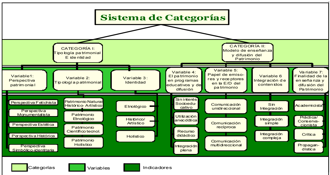
Cuadro 2: Sistema de categorías

Como se ha señalado anteriormente, el instrumento de primer orden para el análisis y sistematización de los datos, se emplea un sistema de categorías, con una serie de variables que se completa con unos indicadores presentados a modo de hipótesis de progresión (Cuadro 2).