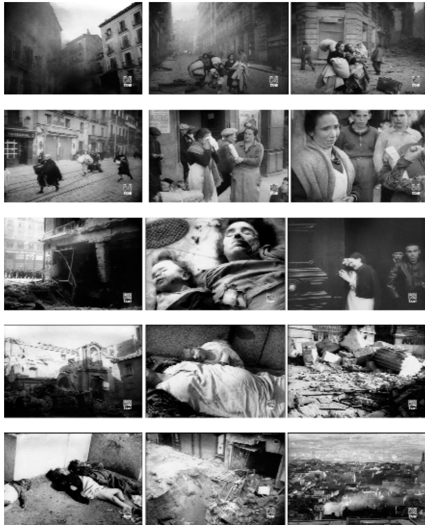
Fig. 2. Roman Karmen y Boris Makaseiev, K Sobitiyam v Ispanii n° 10 ( Sobre los sucesos de España ), filmado en noviembre de 1936 durante un ataque aéreo sobre Madrid.

dar la mayor difusión posible a las imágenes, funcionaron como acicate de esta redundancia en las pantallas republicanas. Por lo demás, la audacia y la maestría de los camarógrafos soviéticos las convertía en un excelente material del que hacer uso en las películas de montaje. Así, estas imágenes del número 10 de Sobre los sucesos de España (Fig. 2) se encuentran reproducidas ampliamente en películas como Spain in Flames (Helen van Dongen, 1937), Heart of Spain (Herbert Kline y Geza Karpathi, 1937), posteriormente en Mourir en Madrid ( Mourir à Madrid ), la película que Frédéric Rossif realizó a comienzos de la década de 1960, y en una larga serie de películas y documentales divulgativos dedicados a la guerra civil desde entonces.