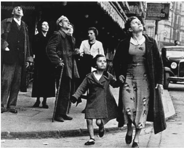
Fig. 1. Robert Capa. Alarma de bombardeo en Bilbao (1937)

Esta fotografía de Robert Capa (Fig. 1) condensa todos los elementos de la escena que precede, en los relatos de orientación republicana, al bombardeo aéreo. Una mujer vestida de calle lleva a una niña cogida de la mano. Mientras mira hacia arriba con desasosiego, ambas aceleran el paso. Los transeúntes que se encuentran en segundo plano, detrás de ellas, miran al cielo con inquie-