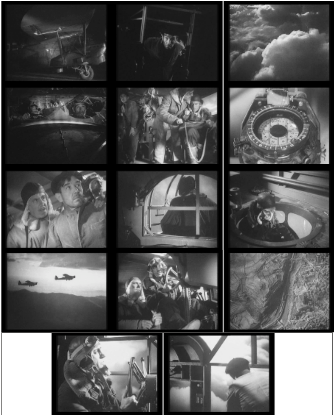
Sierra de Teruel ( L'Espoir , André Malraux, 1938).