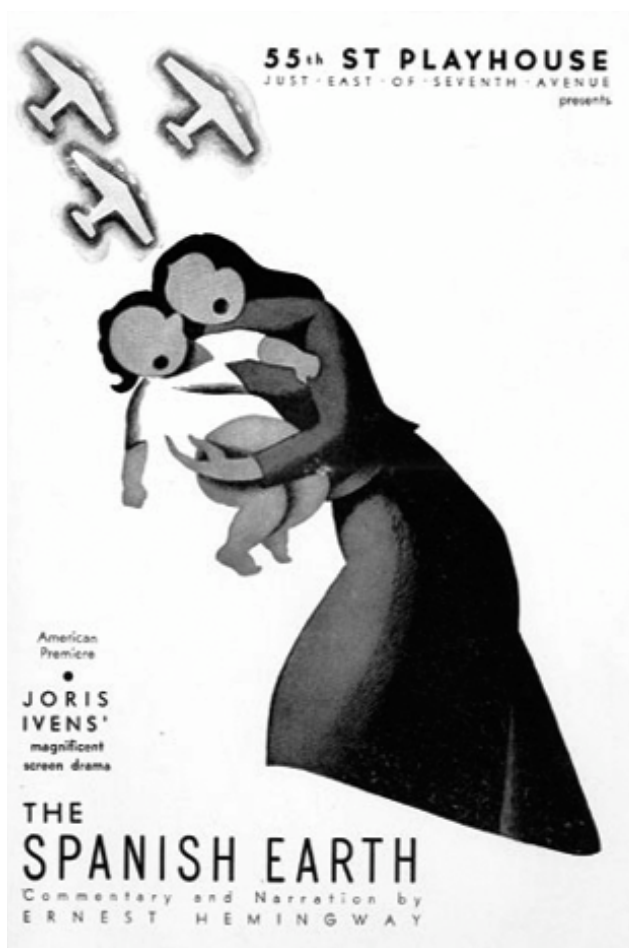
The Spanish Earth (Joris Ivens, 1937)

En Los novios de la muerte observamos una imagen del cielo muy distinta a la que ofrecen las películas de orientación republicana. En un folleto de la época la película se autodefinía como «un relato rápido y exacto sobre la aviación legionaria» 16 . La película surgió a partir de una idea del prestigioso periodista Gian Gaspare Napolitano y como respuesta a la repercusión internacional de películas como Tierra de España ( The Spanish Earth , Joris Ivens, 1937). «A los falsos liberales de América –escribió Napolitano refiriéndose, sobre todo, a Ivens y a Hemingway– hay que responderles como auténticos fascistas. A las películas llamadas imparciales, a los falsos documentales, hay que responder con documentales verdaderos, con películas nacionales y fascistas al cien por cien» 17 . Desde este punto de vista, Napolitano tomaba posición como intelectual fascista dando testimonio de su fe en el mismo escenario internacional,