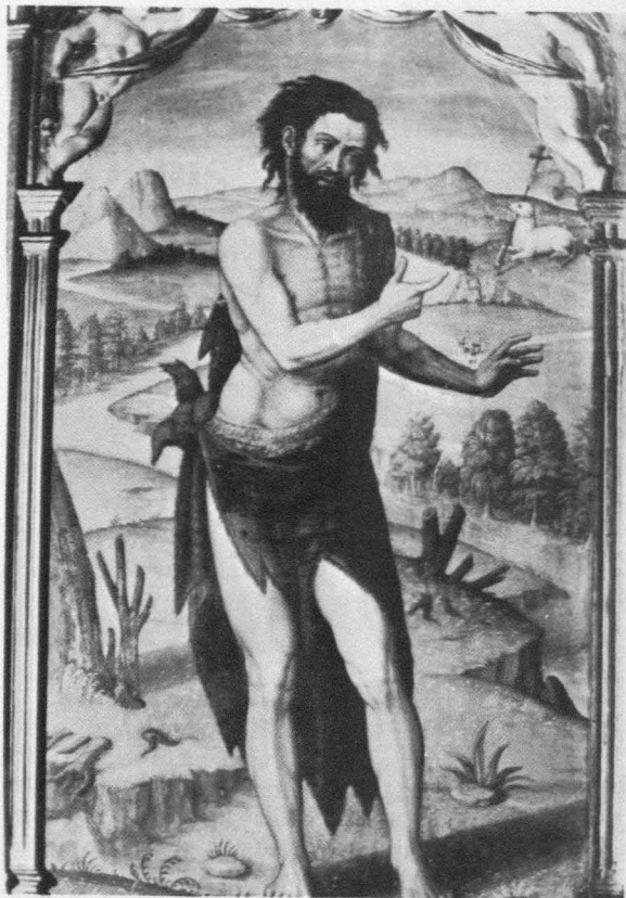
Fig. 14. Gonzalo Gómez (Atribuido). San Juan Bautista. Retablo de los Santos Juanes. Cuenca. Museo Diocesano.