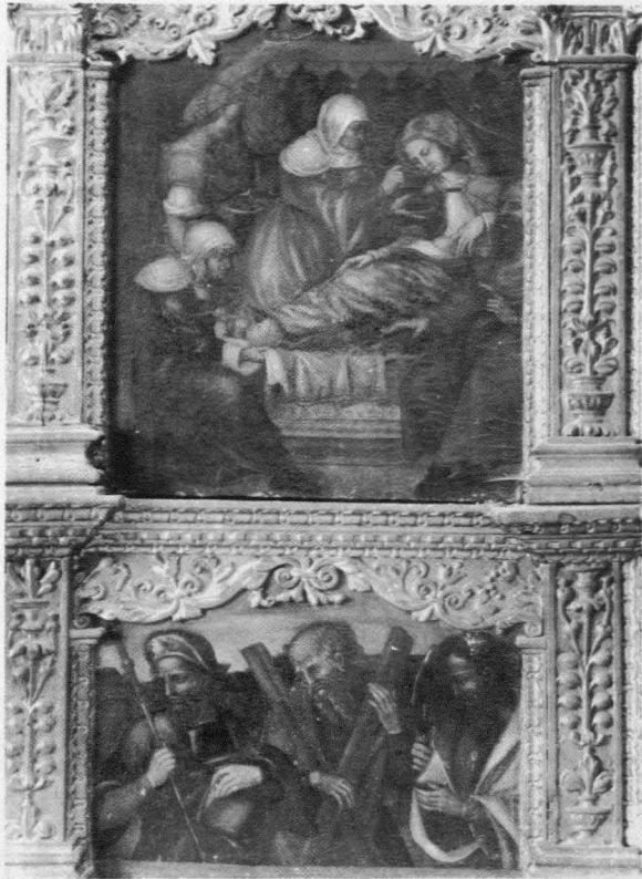
Fig. 12. Gonzalo Gómez (atribuido). Natividad de María. Tres apóstoles . Cuenca. Catedral. Capilla Barreda.