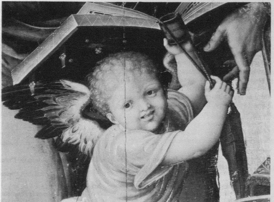
Fig. 9. Martín Gómez el Viejo. Retablo de Santos Lorenzo y Mateo. Detalle. Cuenca. Catedral.