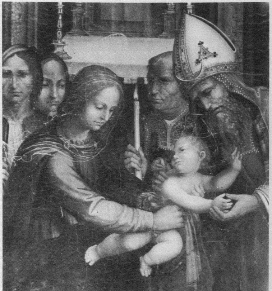
Fig. 8. Martín Gómez el Viejo. Presentación del Niño en el templo. Detalle. Cuenca. Museo Diocesano.