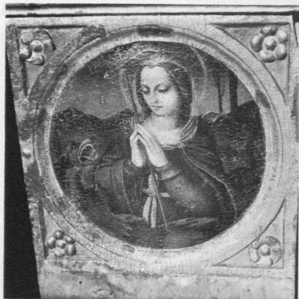
Fig. 10. Martín Gómez el Viejo (atribuido). Santa Quiteria . Cuenca. Depósito diocesano.