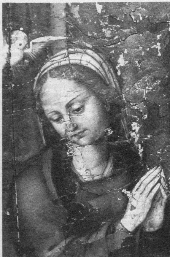
Fig. 3. Martín Gómez el Viejo. Anunciación. Detalle. Valdecabras (Cuenca). Iglesia, Retablo mayor.

Gonzalo de Castro había nacido en 1475, hijo de un judío converso seguramente conquense. En la fecha del