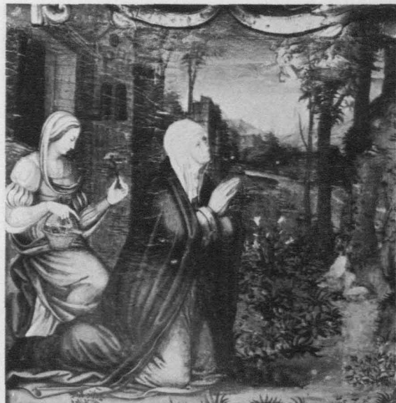
Fig. 1. Martín Gómez el Viejo. Anuncio a Santa Ana. Valdecabras (Cuenca). Iglesia, Retablo mayor.

El segundo grupo, más nutrido, comprende las producciones de mayor excelencia. Todas ellas irradian