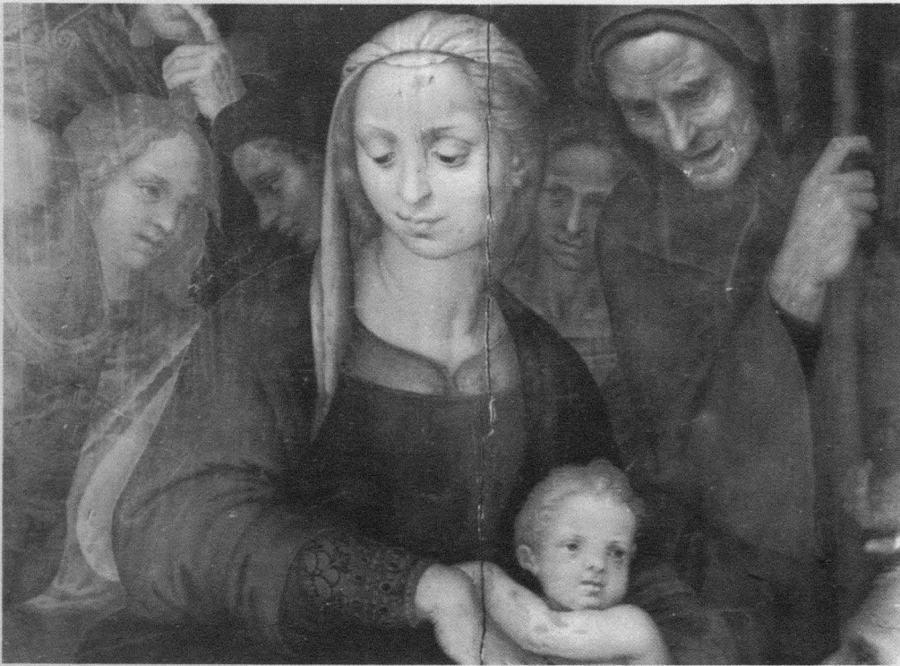
Fig. 7. F. Yáñez de la Almedina. Epifanía . Detalle. Cuenca. Catedral. Capilla de los Caballeros.