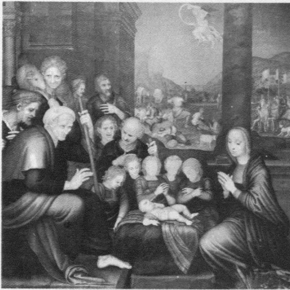
Fig. 4. F. Yáñez de la Almedina. Epifanía . Cuenca, Catedral. Capilla Peso.