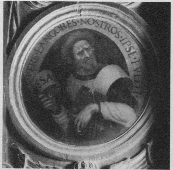
Fig. 5. F. Yáñez de la Almedina. Isaías . Cuenca. Catedral. Capilla de los Caballeros. Retablo de la Crucifixión.

Ignoramos documentalmente que tipo de relaciones unieron a Gómez con el maestro de Almedina aunque, como queda dicho, los análisis estilísticos le confirman como su principal heredero en Cuenca. La asimilación que lleva a efecto del sentido de la monumentalidad y reciedumbre de los caracteres yañezcos no puede explicarse, sin más, como producto de un influjo indirecto a través de la mera contemplación de las obras. La cuestión no estriba en saber si Gómez conoció a Yáñez de la Almedina, que es algo obvio. Lo conocieron todos los pintores que laboraban en Cuenca en los últimos años veinte y primeros treinta. En tal restringido ambiente artístico no podía pasar inadvertido un pintor de la talla del manchego. La discusión se centra en conocer la clase de vínculos profesionales que les unieron. Cuando Post estudia la Presentación del Niño en el Templo del Museo Diocesano, y ante las patentes conexiones con los postigos de la catedral de Valencia, supone obligadamente que Martín Gómez había estudiado con Yáñez en Valencia al comienzo del siglo XVI. O, al menos, había viajado alguna vez a dicha ciudad 12 .