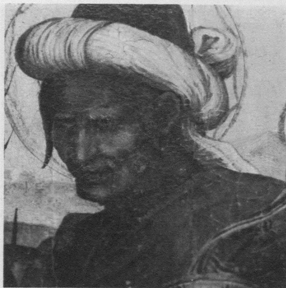
Fig. 11. Martín Gómez el Viejo (atribuido). Visitación . Detalle. Cuenca. Museo Catedralicio.

vidas e inestables, puede considerarse la obra más reveladora de la última fase del pintor, cuando ya su estilo se había impregnado de rasgos manieristas. El ángel de San Mateo llamó la atención de Ponz (Fig. 9), que subrayó la gracia con que está ejecutado. Se relaciona estrechamente con el Niño de la Epifanía de Yáñez, que sigue —como la Virgen de dicho altar— la estampa de tema rafaelesco Virgen y Niño sobre nubes —, grabada por Marcantonio Raimondi, en correspondencia que ha publicado Ana Avila 21 . Martín Gómez debió conocer la citada estampa: su figura se arquea del mismo lado que el Niño del grabado, mientras que la de Yáñez está del lado contrario, invertida. Pero para la ejecución, en aspectos tales como luces y modelado, siguió muy de cerca el trabajo de su maestro.