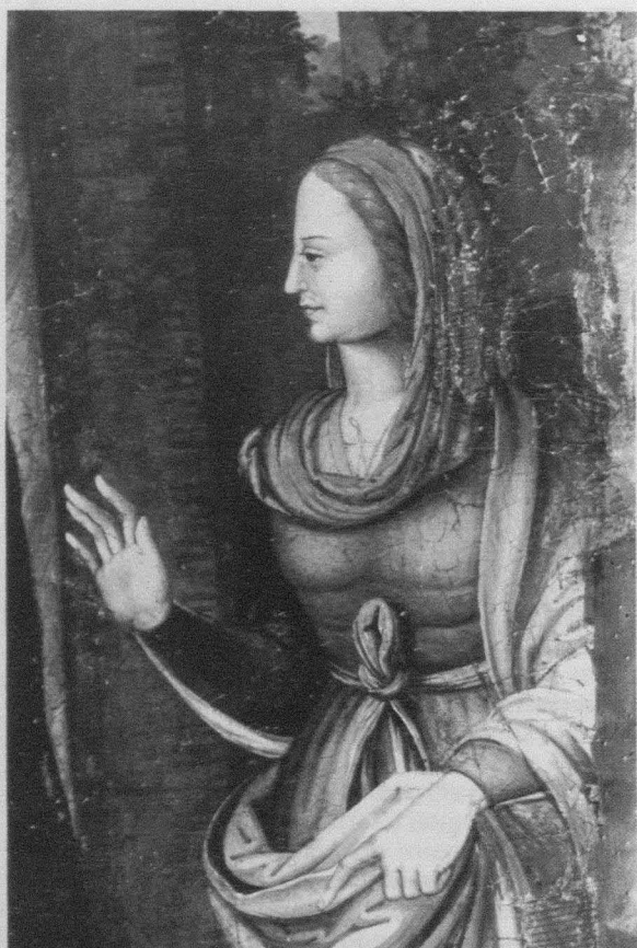
Fig. 2. Martín Gómez el Viejo. Abraço ante la Puerta Dorada. Detalle. Valdecabras (Cuenca). Iglesia, Retablo mayor.

día faltar tan importante referencia. Dentro de esa básica encrucijada para al pintura local que es el retablo de Valdecabras lo encontramos reproducido, con diversos matices, en la Natividad de María , Presentación de la Virgen en el Templo y Anunciación . La Virgen en oración de la Asunción y Coronación de María inicia un prototipo repetido posteriormente hasta la saciedad en la pintura conquense del renacimiento. Una vez más se comprueba la herencia yañezca. El antecedente más inmediato se encuentra en el Martirio de Santa Inés del retablo de la Crucifixión.