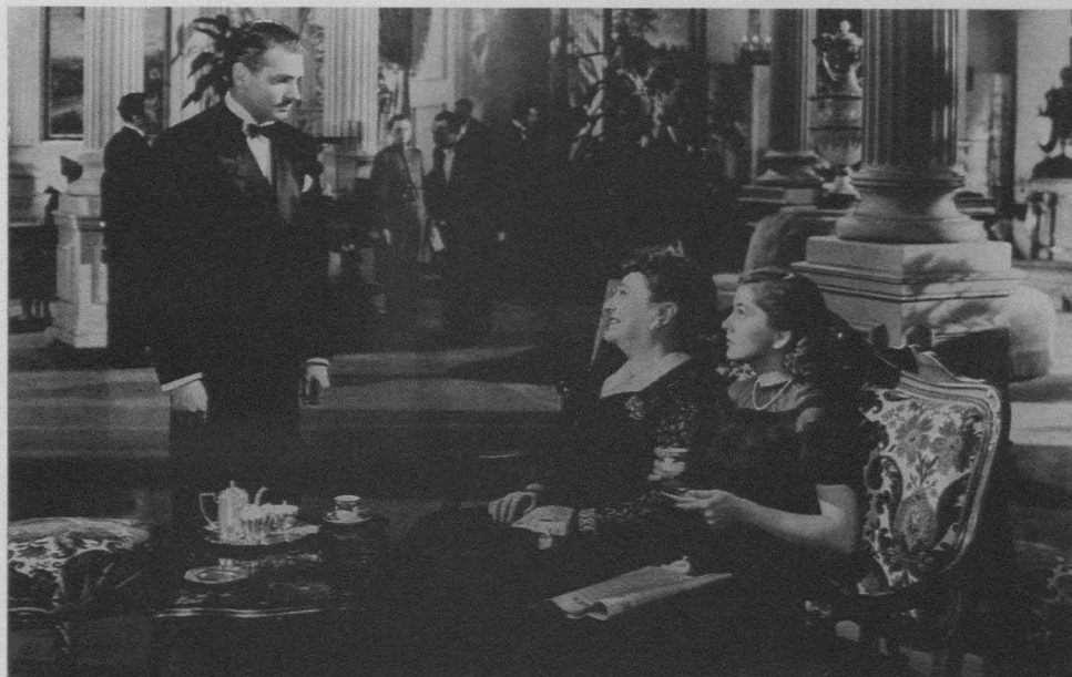
Rebeca (Rebecca), Alfred Hitchcock, 1940

cine. Muchas de las feministas se negaron a aceptar tanto que los personajes femeninos fueran tan pasivos -y así se inició toda una búsqueda, en géneros como el melodrama o el llamado "Cine de mujeres" ( Women's films ), de personajes femeninos más positivos, personajes que contasen sus propias historias-, como empezaron a teorizar acerca de otros tipos de placer que pudiesen explicar la asistencia de las espectadoras a las salas (9).