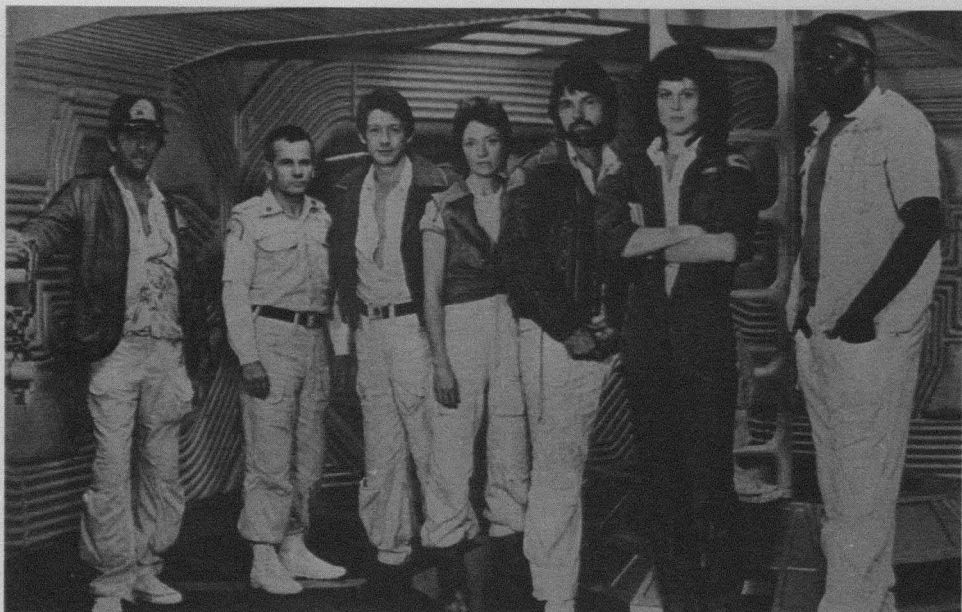
Alien. El octavo pasajero (Alien), Ridley Scott, 1979. Foto de rodaje

mente feminista. Penley defiende que aunque el inconsciente no sea una base idónea sobre la que construir una teoría política feminista -precisamente porque el psicoanálisis defiende que el sujeto está dividido y que su identidad es inestable-, sí que lo es para un feminismo que busque ir más allá del idealismo, de la utopía, del moralismo o de la práctica política y que se interese, sobre todo, por el tema del deseo.