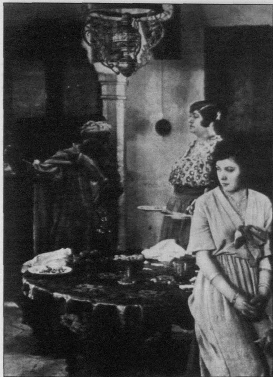
Sarati le terrible, André Hugo, 1937

era un mecanismo común en muchas ficciones que no aclaran la amenaza para hacerla más inquietante. Pero también sugiere que los franceses temían a los nativos sin ser precisamente conscientes de sus razones para ello. Como no reconocían que estos pueblos tuvieran historia, los incluían en una atemporalidad en la que ellos mismos estaban atrapados.