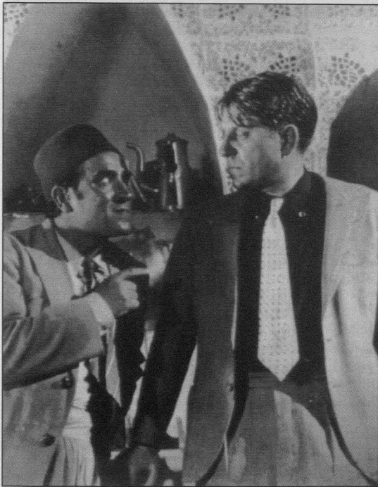
Pépé le Moko ( Pépé le Moko ), Julien Duvivier, 1936

armada, que no hace nada especialmente práctico y cuyos soldados son abatidos tan fácil y tan atinadamente. ¿No estaba Francia, después de todo, en aquel tiempo en la víspera de la mayor derrota de su historia? Pero el punto más impresionante es el hecho de que las películas coloniales representaban grupos de hombres, envueltos en actividades masculinas como la camaradería, la instrucción militar y los combates. Como los rebeldes están prácticamente ausentes de la pantalla, a los nativos no se les atribuye ni un programa político, ni siquiera unas exigencias elementales. Esto, por supuesto, refleja una trágica ignorancia de las aspiraciones nacionalistas entre los pueblos colonizados. Pero la ausencia de cualquier adversario visible refuerza la impresión de los peligros inminentes que rodean a los personajes: estos grupos de hombres están en continuo peligro.