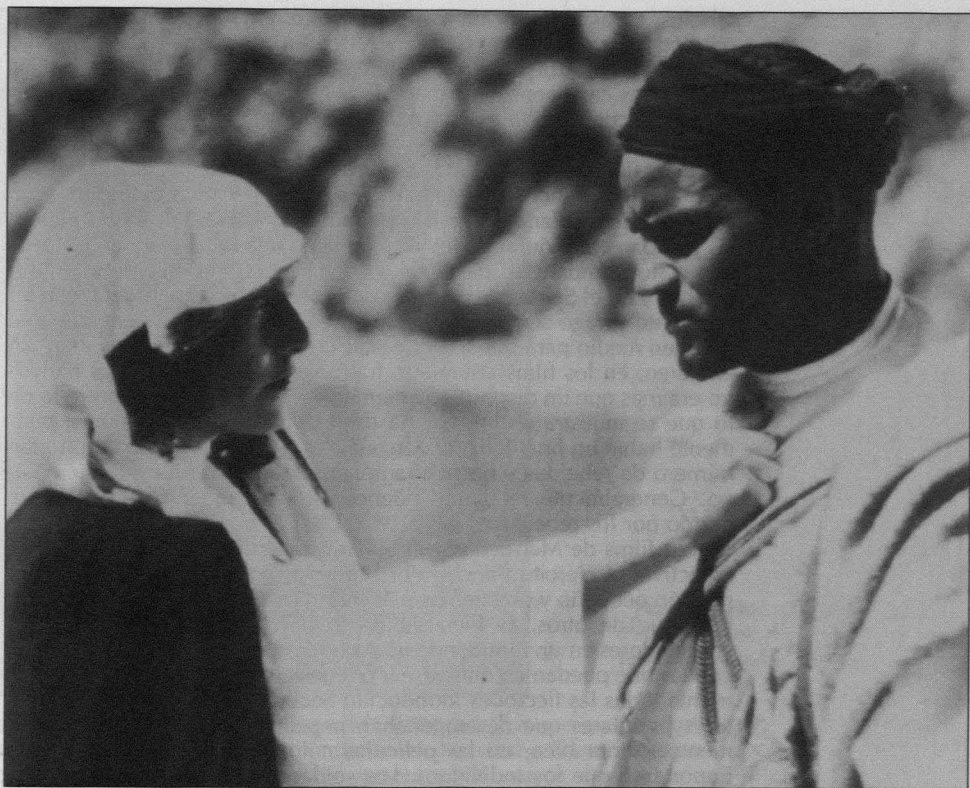
Itto , Jean Benoît-Lévy y Marie Epstein, 1934

en su capacidad especular, es muchas veces la causa del desorden o de la catástrofe» (6) porque, mientras se la mira, los hombres pueden ser atrapados en su propio deseo y las mujeres en sus propios sueños. Presentar a mujeres jóvenes era al mismo tiempo indispensable y conflictivo, mucho más en el contexto colonial, con sus escenarios misteriosos y sus nativos peligrosos, que sugerían otras amenazas para las mujeres pero hacían posible que los personajes femeninos tuvieran otras oportunidades de ser malévolas.