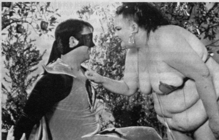
Orgazmo (Trey Parker, 1997).

«El cine pornográfico no es un tema sobre el que a tu madre le gustaría que escribieses», manifestaban hace ya un cuarto de siglo Kenneth Turan y Stephen F. Zito al inicio de su pionera e influyente investigación sobre los orígenes del género 4 . Afortunadamente, las cambiantes circunstancias han generado un entorno mucho más propicio a la hora de acometer este proyecto y han facilitado considerablemente su elaboración. Entre todos los amigos y colegas que aportaron su granito de arena a la preparación y materialización de este monográfico (y al margen, claro está, de los que finalmente aceptaron colaborar en el mismo con un texto), Vicente Sánchez-Biosca ocupa un lugar destacado por su insólita –pero bien grata– confianza. A Ruth Bradley, editora de Wide Angle , la excelente revista de estudios cinematográficos publicada por la Universidad de Ohio, cabe asimismo agradecer su autorización para reproducir en versión castellana el artículo de Susan Pointon.