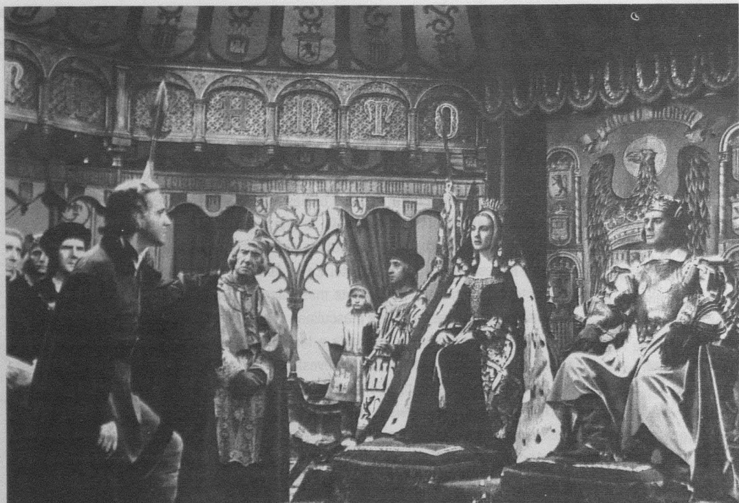
Alba de América (Juan de Orduña, 1951).