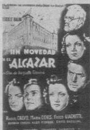
Cartel de Sin novedad en el Alcázar/L'assedio dell'Alcazar (Augusto Genina, 1940).