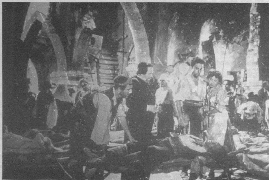
Agustina de Aragón (Juan de Orduña, 1950).