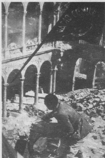
Sin novedad en el Alcázar/L'assedio dell'Alcazar (Augusto Genina, 1940).

9. Para un análisis más detallado de la representación de la mujer en el cine español de los años 1945 a 1951, véase Jo Labanyi, «Feminizing the Nation: Women, Subordination and Subversion in Spanish Cinema, 1945-51», en Ulrike Sieglroh (ed.), Heroines without Heroes: Reconstructing Female and National Identities in European Cinema, 1945-51 (Londres y Nueva York, Cassell, 2000), pp. 163-82.