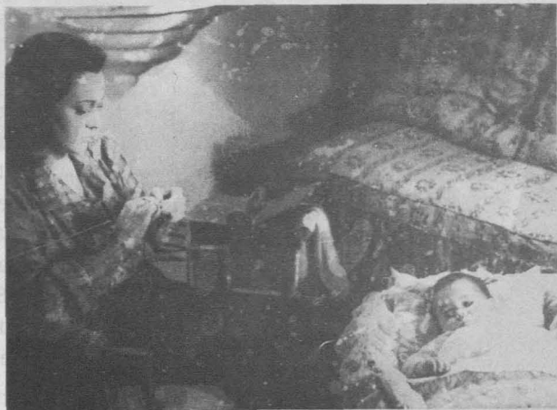
Rostro al mar (Carlos Serrano de Osma, 1951).

la heroína a través de su amor a su hija pequeña –otra vez tenemos el tema del padre sustituto (es decir, padre asexual) que sigue al tipo que encarna San José. La asociación del protagonista nacionalista a la luz, y del protagonista comunista a la oscuridad –como todas las películas de Serrano de Osma, ésta utiliza las técnicas del film noir –, asocia a aquél con una masculinidad sana y protectora, y a éste con una masculinidad peligrosa. Pero la rigidez asexual del primero produce un rechazo y el espectador, al igual que la heroína, se siente atraído por la sexualidad peligrosa pero