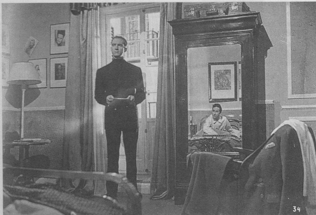
Balarrasa (José Antonio Nieves Conde, 1950).

26. Tania Modleski, Feminism without Women: Culture and Criticism in a 'Postfeminist' Age (Nueva York y Londres, Routledge, 1991), pp. 7, 10, 76-89, hace observar que, en el cine norteamericano de los años ochenta, se repite el tema de la apropiación masculina de la función materna, lo cual, a pesar de la aparente exaltación de lo femenino, sirve para hacer redundante a la mujer. A pesar de las evidentes diferencias históricas, hay cierta semejanza entre la reacción antifeminista de los años ochenta en Estados Unidos, analizada por Modleski, y el intento, por parte del primer franquismo, de eliminar los derechos ganados por la mujer bajo la Segunda República.