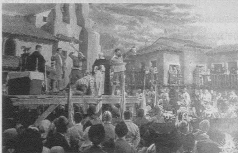
La Leona de Castilla (Juan de Orduña, 1951).

22. La película se basa en la obra de teatro de 1909 de Eduardo Marquina, padre del director. Un número considerable de películas de los años cuarenta se basan en textos dramáticos o literarios anteriores a la guerra, lo cual invita a la reflexión sobre la manera en que estas películas se aprovechan de textos anteriores para tratar, de modo mediatizado, problemas contemporáneos. La adaptación de la obra clásica de un autor políticamente conservador sirvió en varias ocasiones de estrategia para conseguir la autorización del censor para una película