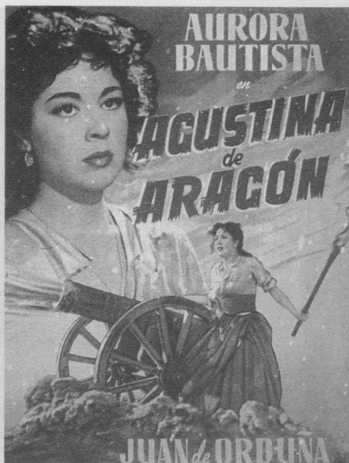
Cartel de Agustina de Aragón (Juan de Orduña, 1950).

24. Véase Francisco Javier Pérez Rojas y José Luis Alcaide, «Apropiaciones y recreaciones de la pintura de historia», en J.L. Díez García, La pintura de historia del siglo XIX en España (Madrid, Museo del Prado, 1992), pp. 110-11, quienes también aportan una documentación valiosa acerca de la recreación minuciosa en el cine épico de Cifesa, sobre todo en las películas de Orduña, de obras famosas de la pintura de historia decimonónica. Es lógico que el cine histórico del primer franquismo haya hecho eco de la pintura de historia de la segunda mitad del siglo XIX, puesto que los dos periodos se caracterizan por un intenso proceso de formación nacional, a través del control social ejercido sobre la familia y especialmente sobre la mujer.