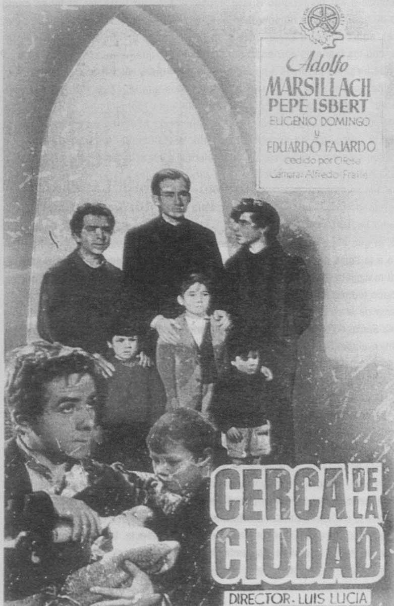
Cartel de Cerca de la ciudad (Luis Lucía, 1952).

vemos de paso en la calle) 28 . Éste es un mundo enteramente masculino, en el que los padres —criminales o borrachos— son figuras negativas, por lo menos hasta aprender del padre José el valor de lo materno. En la secuencia final el padre de los niños recogidos por el padre José, recién salido de la cárcel entra en la iglesia durante la del Gallo, en Nochebuena. De nuevo, todos los niños en la iglesia son varones (y también casi todos los adultos); la figura más netamente femenina es la del Niño Jesús que preside el altar y que aparece en un primer plano con su faldita corta y rizados a lo Shirley