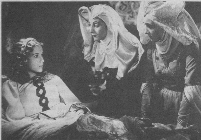
Reina santa (Rafael Gil, 1946).

santa (Rafael Gil, 1946), el rey poeta y músico portugués, Don Dionis, provoca la guerra civil por desatender los asuntos de estado y procrear a una serie de hijos bastardos. Según la letra de una de sus canciones: «Soy el hombre más servicial... rendido siempre»; para él, el amor significa la sumisión femenina. Pero, según se comenta en el diálogo, los valores morales de su 'reina santa' aragonesa, Isabel, también