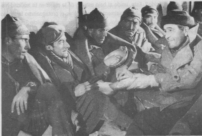
Rostro al mar (Carlos Serrano de Osma, 1951).

la heroína a través de su amor a su hija pequeña –otra vez tenemos el tema del padre sustituto (es decir, padre asexual) que sigue al tipo que encarna San José. La asociación del protagonista nacionalista a la luz, y del protagonista comunista a la oscuridad –como todas las películas de Serrano de Osma, ésta utiliza las técnicas del film noir –, asocia a aquél con una masculinidad sana y protectora, y a éste con una masculinidad peligrosa. Pero la rigidez asexual del primero produce un rechazo y el espectador, al igual que la heroína, se siente atraído por la sexualidad peligrosa pero