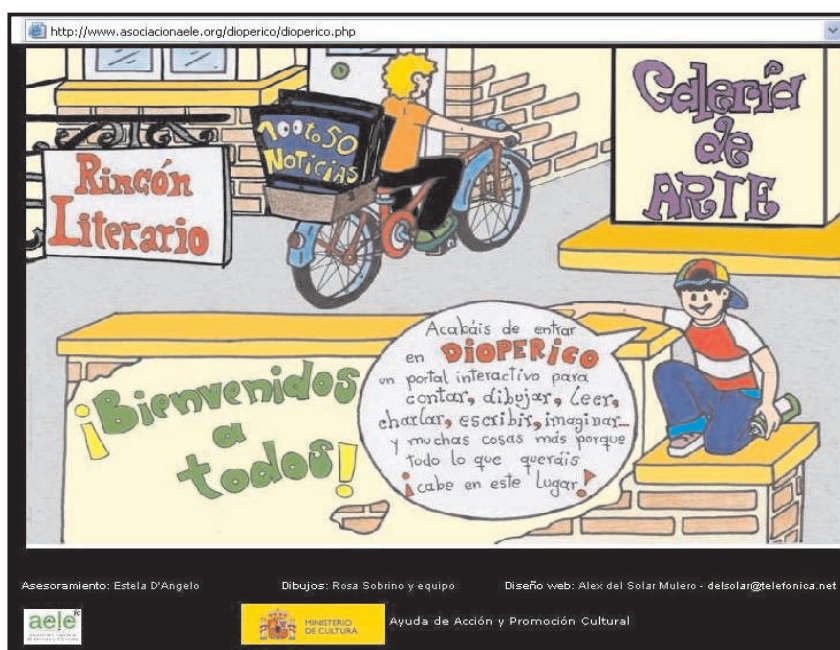
FIGURA 1: Página de bienvenida del portal Dioperico

El Rincón Literario es un espacio que invita a escribir textos que fundamentalmente tienen un carácter literario –como pueden ser los poemas, los cuentos, las novelas, los guiones de teatro, los relatos cortos...–sin embargo, también tienen pueden enviarse los textos biográficos, humorísticos -como los cómics, los chistes...–, o textos tradicionales –como las canciones, las adivinanzas, los dichos populares...–, entre otros. Las secciones en que se organizan todos estos potenciales textos son las siguientes: “Cuentavidas” (biografías), “¡Puedes escribirlo” (narraciones sobre cualquier temática), “Tras el rastro” (informes sobre investigaciones), “¿Por qué se dice...?” (refranes, canciones, dichos populares) y “Palabras y palabros ” (definiciones sobre palabras conocidas o inventadas).