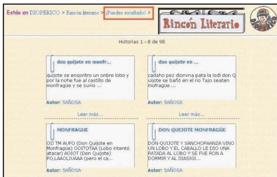
FIGURA 5: Un grupo de niños de 5 años han enviado sus trabajos sobre las aventuras de Don Quijote y Sancho Panza en Monfragüe a la sección “¡Puedes escribirlo!” del Rincón Literario.

En esta experiencia, es importante valorar, por un lado, que las producciones escritas de muchos de los alumnos participantes han podido mejorarse en función del nivel de conceptualización del lenguaje alcanzado en cada caso y, por otro, que todos los niños y niñas han podido participar en un proceso de comunicación digital compartiendo con otros sus propias historias (véase Figura 6).