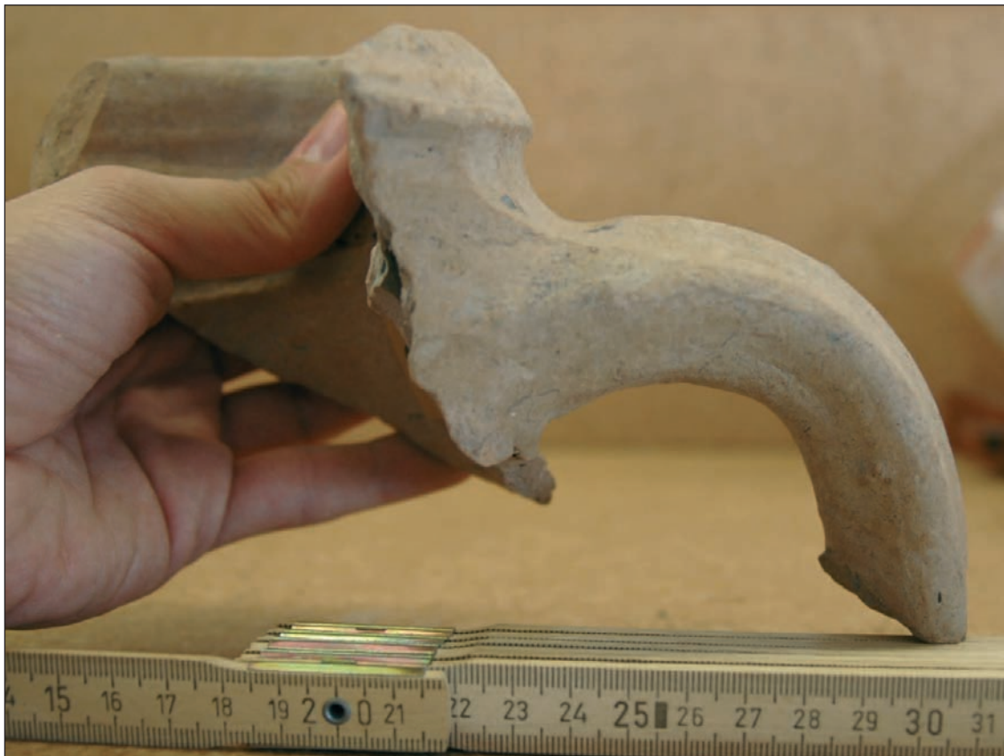
Figura 5: Parte superior de Dressel 23 aparecida en un contexto del siglo IV en Augst.