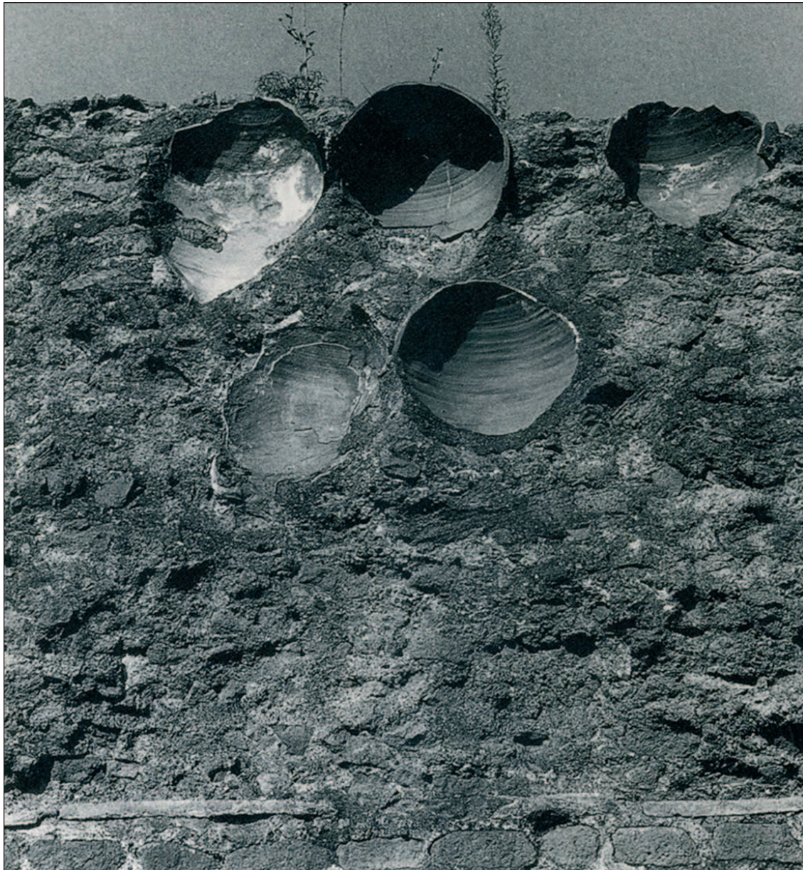
Figura 7: Vista de ánforas Dressel 23 utilizadas en la construcción de las bóvedas del denominado circo de Majencio en Roma.