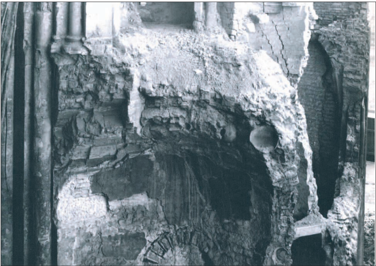
Figura 3: Interior de una de las cúpulas de Sankt Gereon tras los bombardeos aliados sobre Colonia. Pueden observarse perfectamente varias ánforas.