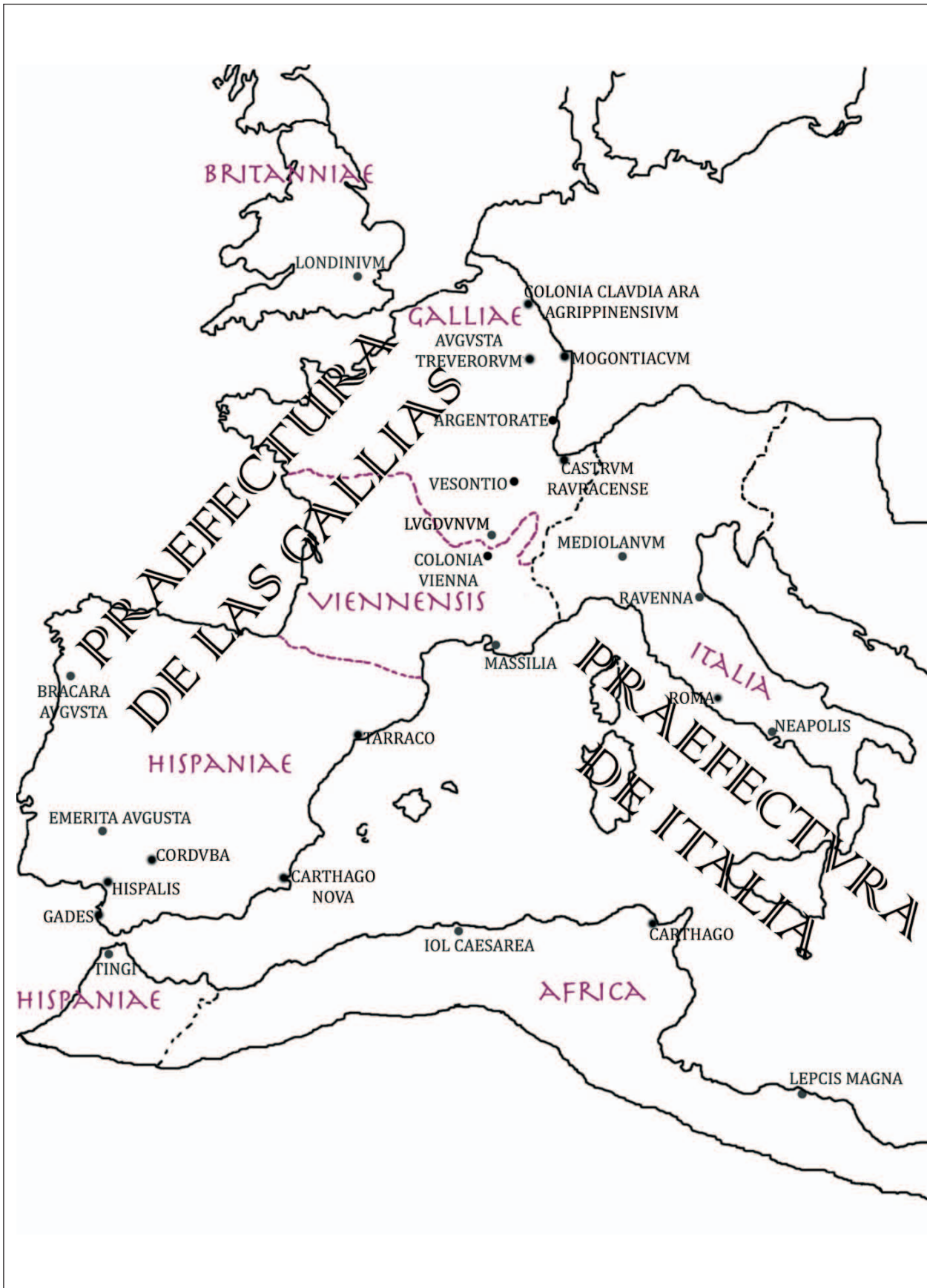
Figura 1: El imperio romano de occidente a partir de la reordenación territorial de época de Diocleciano.