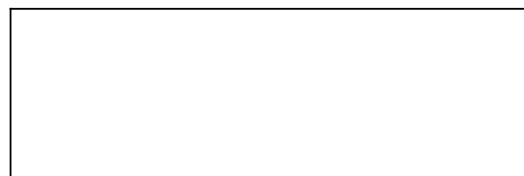
Hr Ra-mes-sw (El Horus Ramsés)