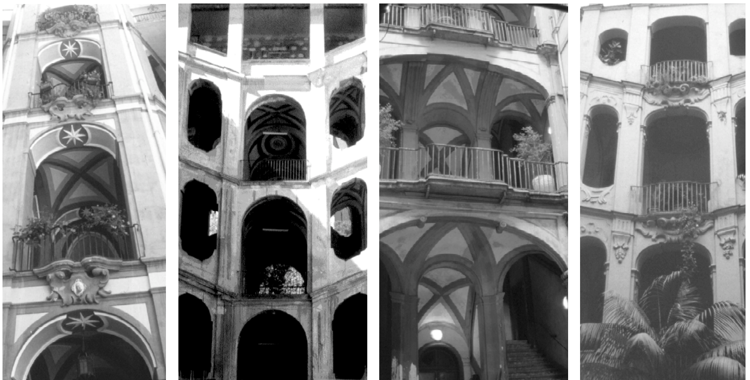
Figuras 1 a 4

Para reencontrarnos con Sanfelice y los Borbones, ahora en concreto con el mismísimo Carlos de Borbón, hemos de esperar lógicamente hasta los primeros años treinta. Aunque desde De Dominici haya circulado la idea -no abandonada por autores recientes como Yves Bottineau o Anthony Blunt 12 - de que el nuevo Rey de Nápoles mantuviera una especie de actitud vindicativa, a causa de la colaboración de Sanfelice con las autoridades del precedente y antagonista virreinato austriaco, apartándolo de las más importantes comisiones y desbancándolo de su posición privilegiada, a través de su apoyo a la mediocridad arquitectónica que habría constituido Giovanni Battista Medrano, convertido en la contrafigura de Sanfelice, un análisis menos apasionado y maniqueo de la situación, debiera llevarnos a constatar una coyuntura mucho más compleja y unos comportamientos no solamente justificados por supuestas actitudes primarias.