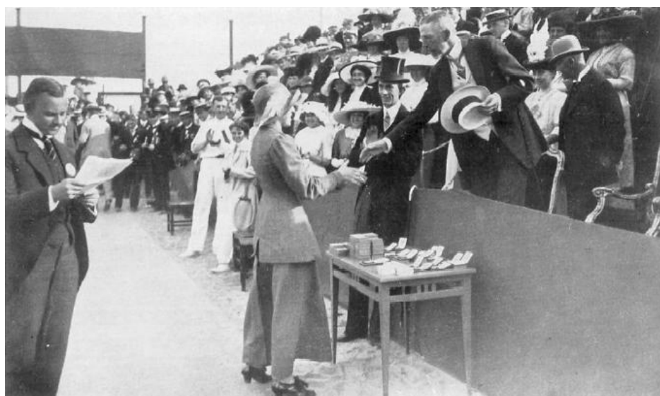
H. M. THE KING PRESENTING PRIZES FOR LAWN TENNIS COMPETITIONS (out-of-door courts).

Fotografías protocolarias de los vencedores y la entrega de premios por parte del Rey de Suecia (Fotos oficiales, pl. 29 & 235)