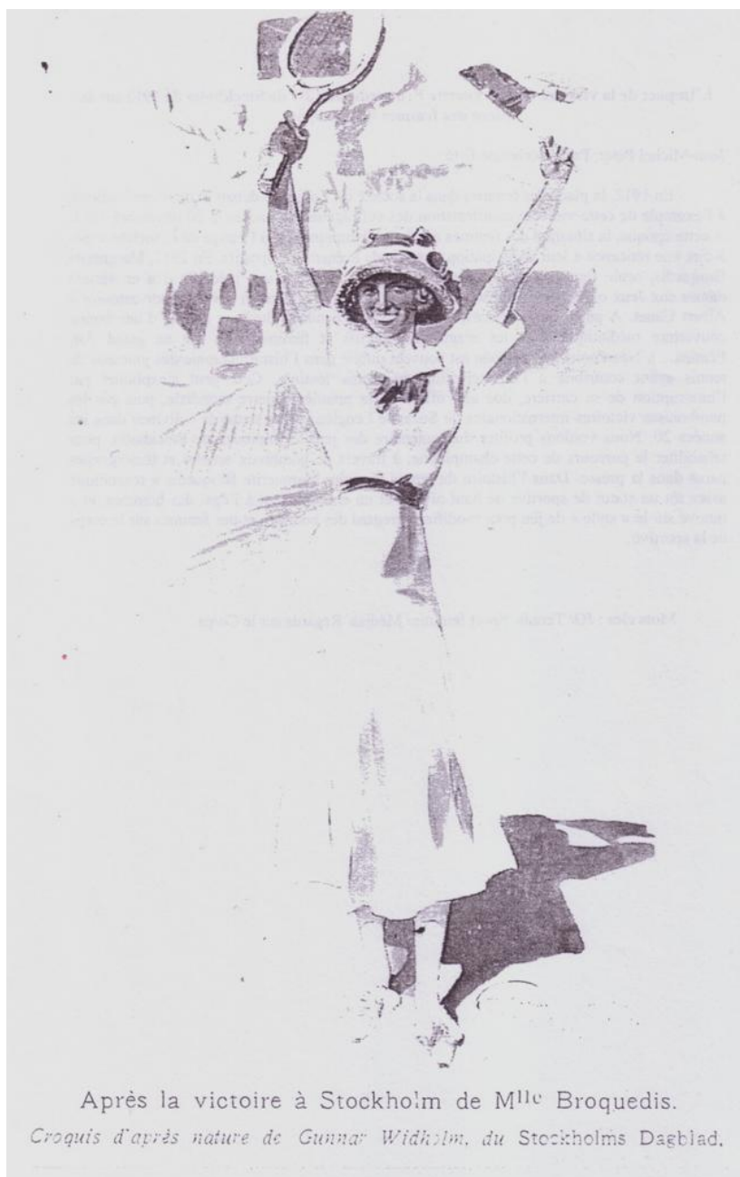
Victoria en Estocolmo de Mlle Broquedis, Illustration n° 3622, p.24, 3 julio 1912. Dibujo del natural de Gunnar Widholm.