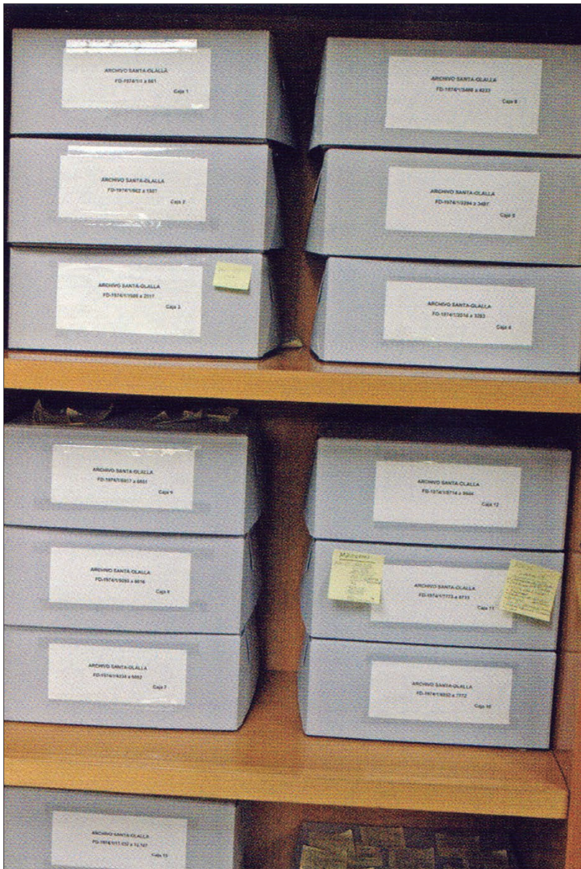
Fig. 5. Estado actual del archivo con los documentos depositados en horizontal en carpetillas de cartulina neutra y éstas en cajas de cartón neutro.