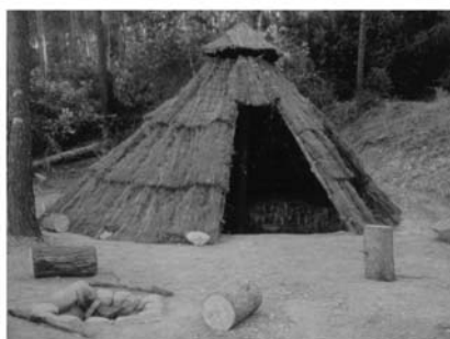
Fig.4: Cabaña neolítica reconstruida en el Patronat Flor de Maig.

Dificultades, ventajas, nuevos objetivos y planteamientos... Hemos pretendido mostrar escuetamente un aspecto diferente de la experimentación en arqueología, que utiliza la reproducción como herramienta pero que va mucho más allá de la mera copia estática o de la demostración de actividades con ánimos lucrativos. Somos conscientes de que es imposible resumir en estas páginas todos los contenidos que pretendíamos: simplemente lo damos a conocer.