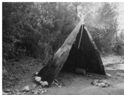
Fig.2: Paraviento paleolítico reconstruido en el Patronat Flor de Maig