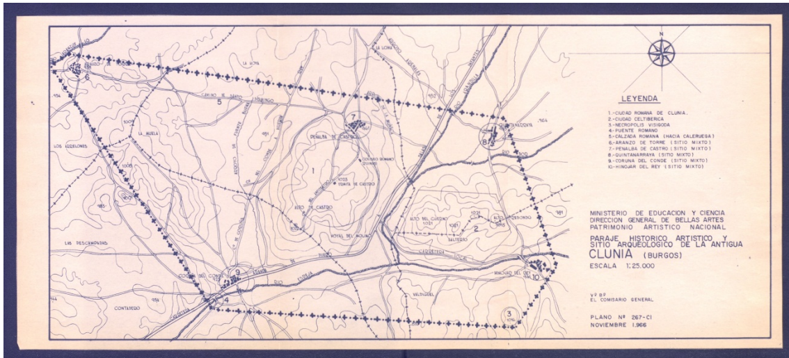
Plano de Clunia