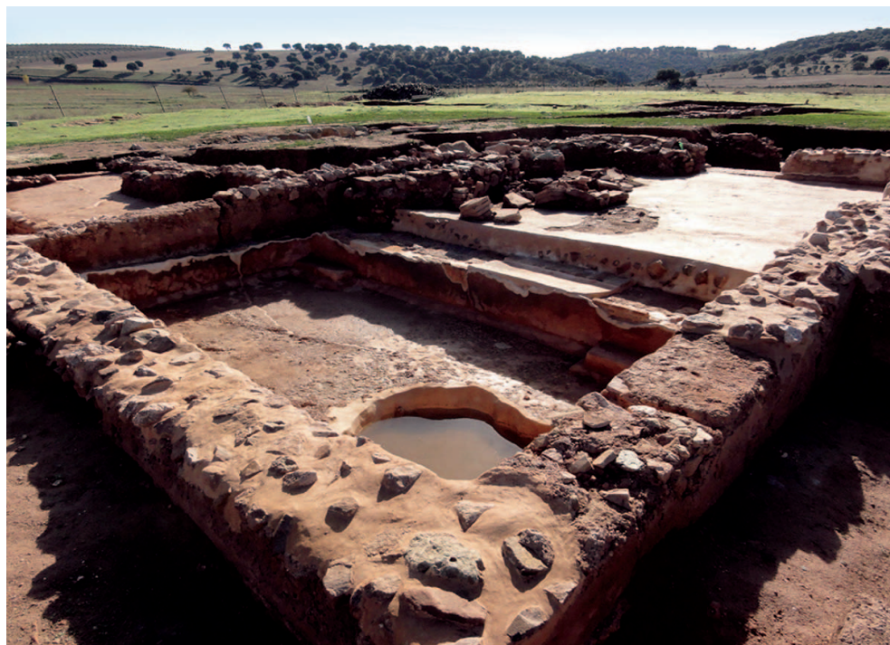
Vista general del yacimiento en la que pueden apreciarse la natatio , la letrina y la estancia 9, tras una jornada de lluvias, una vez concluida la campaña de 2010. Las protecciones realizadas durante la intervención son útiles, sin embargo no son medidas definitivas, sino que, para asegurar la conservación del yacimiento, lo más recomendable es la construcción de una cubierta y un sistema de evacuación de aguas que evite estas inundaciones.

Los objetivos propuestos al comienzo de esta campaña se han cumplido: se ha llevado a cabo una intervención de urgencia en la que se han consolidado y protegido las estructuras excavadas en campañas anteriores, las cuales llevaban años expuestas a los agentes atmosféricos, desde su descubrimiento. Sin embargo, aunque se ha dado prioridad a los elementos más inestables y vulnerables a la acción de los agentes de deterioro, este trabajo no se ha concluido