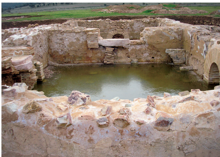
Fotografía realizada en enero de 2011, tras un periodo de lluvias y heladas en el que se inundaron considerablemente varias de las estancias del conjunto termal.

tancias y genera la degradación de los materiales constructivos, sobre todo los morteros, y la separación de los diferentes estratos que componen las construcciones. No obstante, además del deterioro producido por los agentes meteorológicos, debemos añadir el provocado por la acción humana: gran parte del material constructivo de las termas fue expoliado en época posterior para su reutilización, de lo que se deriva la desaparición de elementos como ladrillos, mampostería, etc., que en el mejor de los casos provenían de los derrumbes; pero en otros casos eran directamente extraídos de las unidades constructivas afectando a su estabilidad, como es el caso de dos vanos con forma de arco de medio punto que se hallaban en peligro de derrumbe al inicio de la campaña, ya que de ellos lo único que quedaba era el opus caementicium con la forma del vano, al haber desaparecido las dovelas de ladrillo que componían el arco.