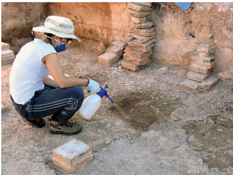
Consolidación del suelo del caldarium con silicato de etilo.

Como medida preventiva para ralentizar el proceso de deterioro, principalmente de aquellos elementos que por falta de tiempo no ha sido posible intervenir, se ha realizado una consolidación general tanto en los muros como en los suelos y revocos mediante silicato de etilo 9 al 11 % en White Spirit, concretamente la marca comercial ESTEL 1100, que cuenta además con un hidrofugante, favoreciendo la acción del silicato de etilo, puesto que evita en gran medida la entrada de agua y por tanto también la de las sales solubles en el interior del material (Luque et al. 2008: 122). Se ha aplicado mediante vaporización, con la ayuda de pistolas de presión manual.