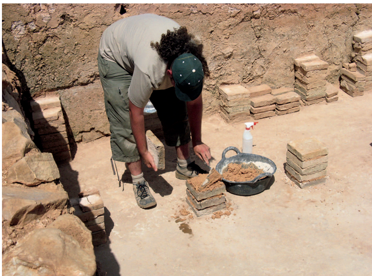
Alumno en prácticas realizando la consolidación de una de las pilae del caldarium .

Los muros, cuya parte más expuesta a la acción de los agentes de deterioro es la parte superior, se protegieron para evitar que el mortero original siguiera deteriorándose.