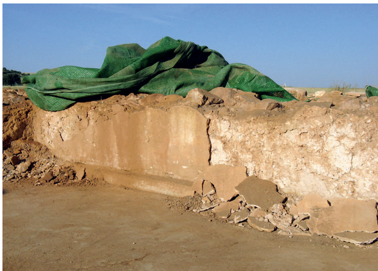
Derrumbe de los enlucidos que recubren los paramentos de la estancia 9.

El problema con el que nos encontramos era el mismo que en los casos anteriores: la disgregación del mortero original que provocaba la separación de los ladrillos y el derrumbe de las pilae . Debemos recalcar que estas estancias se han inundado en varias ocasiones desde su descubrimiento, por lo que la exposición de los morteros al agua ha sido muy directa. Sin embargo, las piezas de ladrillo se encontraban en muy buen estado de conservación, salvo algún caso muy puntual en el que alguna pieza se encontró fragmentada o incluso disgregada (en este caso es más probable que se trate de un problema de factura más que de conservación).