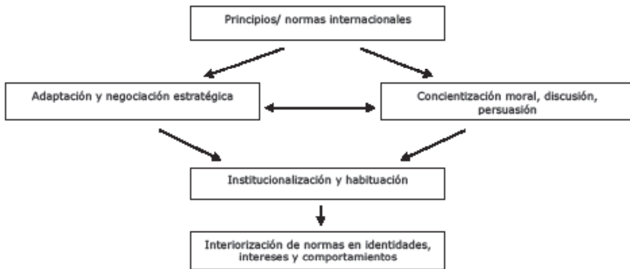
Figura 1.1 El proceso de socialización de las normas

Estos procesos constituyen los tipos ideales que difieren según su lógica subyacente o modo de acción e interacción social. En realidad, estos procesos normalmente toman lugar de forma simultánea. Nuestra tarea en este libro es identificar qué modelo de interacción es dominante en qué fase del proceso de socialización. Sugerimos un orden aproximado, representado en la figura 1.1.