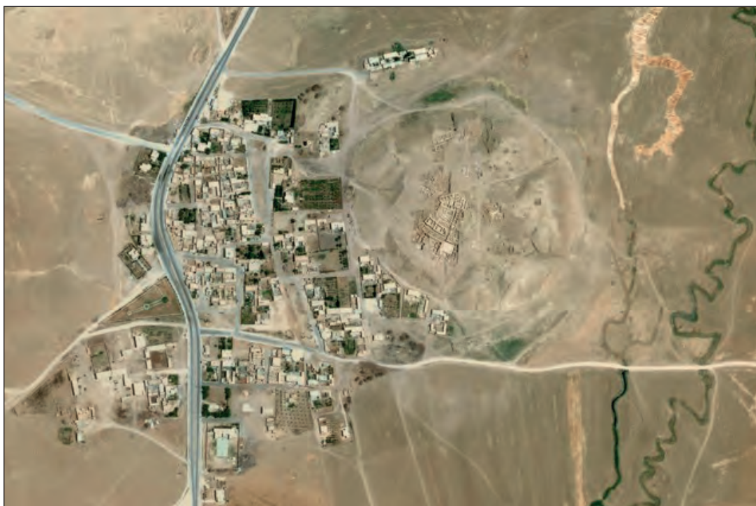
Fig. 2. Fotografía aérea de Tel Beidar y sus alrededores.

Se trata de una ciudad de importancia media, de 25 hectáreas de superficie, ciudad circular que tenía un doble sistema de fortificación con siete puertas orientadas a todas las direcciones 2 . Las investigaciones se centraron sobre todo en la última ocupación, de la época llamada Yazira Arcaica III B, c. 2500 - 2.340 a.n.e. El nombre del asentamiento durante este periodo era Nabada, o Nabatium, y fue uno de los lugares centrales del reino de Nagar, cuya capital se encontraba en el actual yacimiento de Tel Brak. Nagar era una de las potencias de la Alta Mesopotamia, a mismo título que otros reinos, como Ebla o Mari, e intervino en numerosos conflictos por la supremacía en la región.