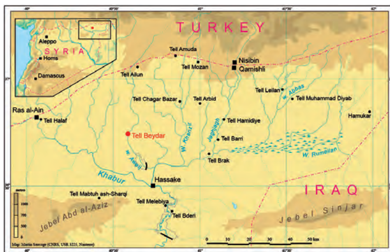
Fig. 1. Localización de Tel Beidar en el triángulo del Jabur.

El asentamiento de Tel Beidar se encuentra situado en la llanura sedimentaria de la Alta Mesopotamia 1 , en la zona que está por encima de los 200 mm precipitaciones anuales, lo cual permite la agricultura de secano, en una región donde la ganadería sedentaria convive con el nomadismo desde hace milenios. Las rutas que desde tiempo inmemorial la atraviesan han dado una posición privilegiada a la zona en el comercio internacional a lo largo de la historia.