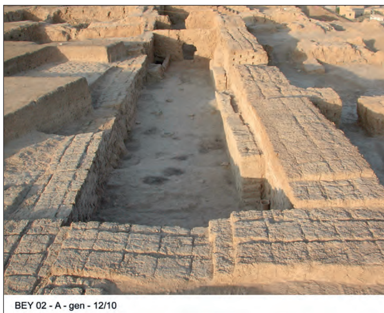
Fig. 5. Antecámara rectangular del palacio helenístico.

El descubrimiento de este edificio trae consigo consecuencias de primer orden para el estudio de la Alta Mesopotamia helenística. Hasta ahora teníamos algún conocimiento sobre la evolución de la arquitectura griega en la región gracias a los descubrimientos de Dura Europos y de Yebel Jaled, pero, no sabemos nada sobre la evolución de la arquitectura indígena durante la época. Las excavaciones de Tel Beidar demuestran que las antiguas tradiciones mesopotámicas aún no habían perdido su fuerza y continuaban mostrando sus particularidades en un momento en el que la región había recibido una fuerte influencia del mundo griego. Pero lo más importante, sin duda, es que estamos empezando a obtener información más detallada sobre los distintos elementos que jugaron un papel en el periodo en el que se estaba formando la cultura greco-semítica, bien conocida a partir del periodo romano.