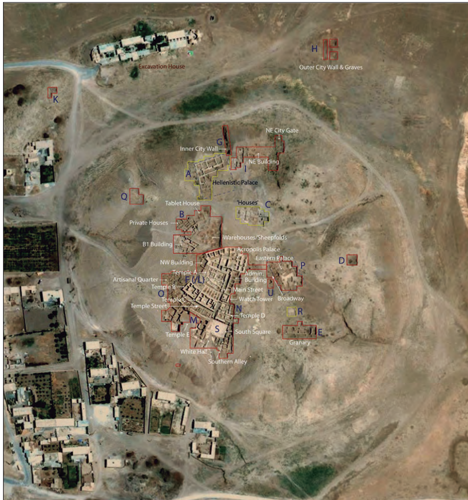
Fig. 3. Fotografía aérea de las excavaciones, en la que se puede apreciar claramente el plano urbanístico.

En el centro de la ciudad se excavaron sus edificios oficiales, entre otros, dos palacios y cinco templos. Todos ellos estaban equipados con instalaciones hidráulicas, sala de baño y letrinas. Las aguas usadas eran evacuadas, por medio de conductos de canalización, hacia el exterior de la ciudad. Los suelos y los muros de los espacios interiores estaban enlucidos con yeso blanco.