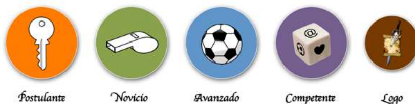
Figura III. Modelos de insignias (chapas)

Recompensa física que indica el nivel alcanzado por cada jugador a lo largo de la aventura. Las insignias (o badges ) utilizadas en “La Profecía de los Elegidos” son unas chapas (figura III) con una imagen diferente para cada uno de los 4 niveles existentes. Además, los subniveles se representan con una chapa más pequeña con el logo del juego.