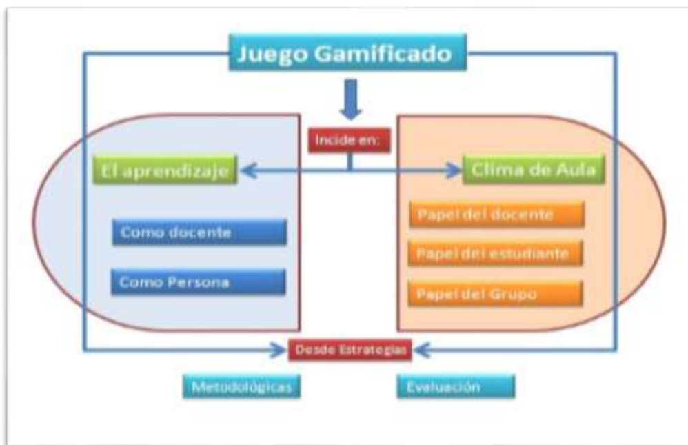
Figura IV. Mapa conceptual explicativo teórico

La comprensión del fenómeno se realiza desde la metodología cualitativa (Stake, 1995). Strauss y Corbin (2002) identifican el valor de esta metodología no solo en generar teoría, sino también en fundamentarla en los datos. En nuestro caso: el significado de los aprendizajes en la experiencia de gamificación vivida. La información producida se analiza desde la Teoría Fundamentada, porque al basarse en los datos es más posible que generen conocimiento, aumenten la comprensión y proporcionen una guía significativa para la acción (Strauss y Corbin, 2002).