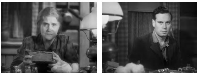
Figs. 31 y 32. Peregrinos .

las argucias de la mujer malvada . La madre parece así tratar de usurpar el lugar que naturalmente corresponde a Mary como potencial esposa [Figs. 31 y 32].