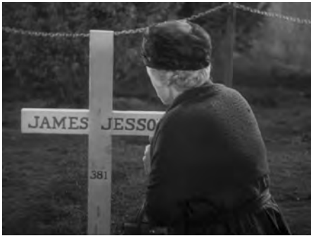
Fig. 36. Peregrinos .

[26] Ford ya había llevado a la pantalla este relato de Peter B. Kyne en Hombres marcados ( Marked Man , 1919) y repitió parte de la trama en Tres hombres malos ( Three Bad Men , 1926), lo cual da una idea de la inclinación que sentía por la historia.