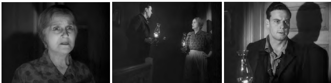
Figs. 33, 34 y 35. Peregrinos .

La sentimentalidad de Ford, sin embargo, no parece proclive a dibujar un retrato materno de tal mezquindad y acaba por conceder a Hannah la opor-