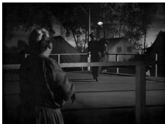
Fig. 5. Las uvas de la ira .

En Las uvas de la ira , Tom trata de escapar del campamento amparado en la noche, pero Ma, atenta siempre a los movimientos de sus retoños, escucha unos ruidos y lo descubre. Tom trata de explicarle la apremiante necesidad que le induce a abandonarlos para ayudar a mejorar las cosas y, aunque ella, cuya mirada no puede alcanzar más allá de los límites de su propia familia, le confiesa no comprenderlo, tampoco lo retiene. Ma Joad observa a Tom alejarse del campamento en un plano en el que madre e hijo, situados ya en términos separados de la composición, comparten aún encuadre [Fig. 5]. Una vez que Tom ha dejado atrás a su familia, la oscuridad del siguiente plano general envuelve en luto la figura solitaria de la mujer. Su mirada permanece clavada en el lugar por donde ha partido su hijo, y la compo-