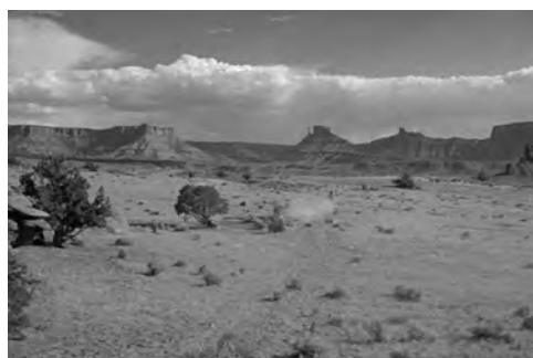
Figs. 24, 25, 26 y 27. Río Grande ( Río Grande , John Ford, 1950).