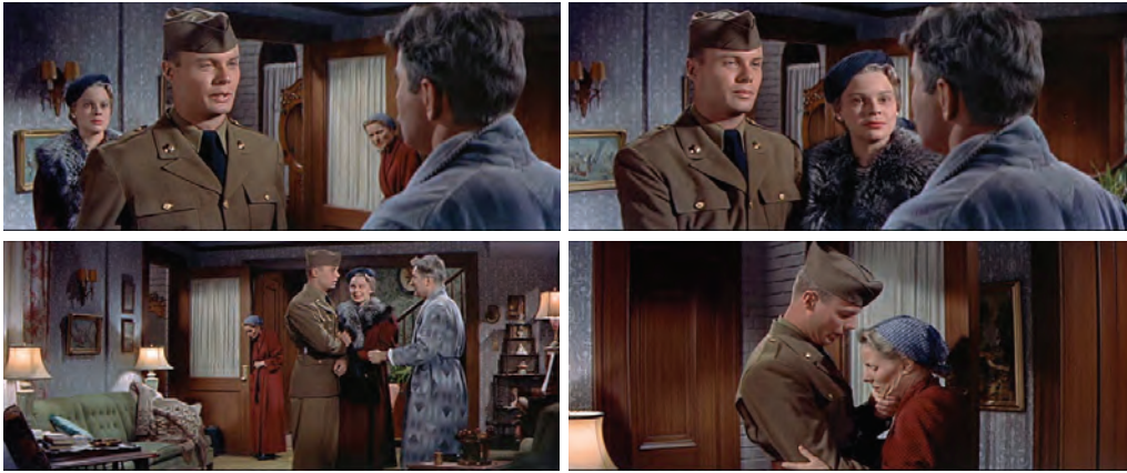
Figs. 18, 19, 20 y 21. Cuna de héroes .

término entre los dos hombres y significativamente más pequeña que el resto de personajes, se observa a Mary abatida [Fig. 18]. Cuando Kitty, la auténtica madre de Red, en pie tras él en señal de respaldo, se traslada a su lado para declarar que ella está orgullosa de su hijo, borra literalmente del encuadre la figura de la otra madre, reafirmando su propio puesto [Fig. 19]. El siguiente plano ilustra la posición marginal de Mary en la estampa familiar [Fig. 20]. Como Beth Morgan en ¡Qué verde era mi valle! [Fig. 8], permanece apoyada en el quicio de la puerta evitando mirar al resto de la familia que parece alegrarse por la decisión del muchacho, aunque en esta ocasión el efecto de la profundidad de campo y la dimensión del cuadro en Cinemascope subrayan la soledad y la distancia con mayor crueldad. Ella no desea ver partir a Red y se lanza a sus brazos apartando la mirada, pero, a diferencia de Tom Joad y los hermanos Morgan, este la obliga a mirarlo a los ojos para decirle adiós [Fig. 21].