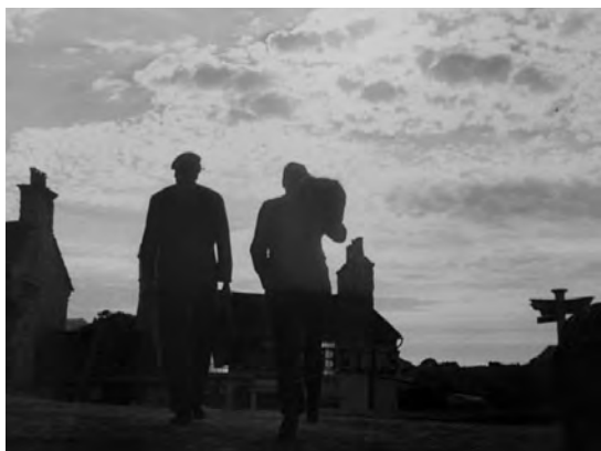
Fig. 15. ¡Qué verde era mi valle!