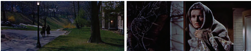
Figs. 22 y 23. Cuna de heroes .

Tal como sucedía en los filmes anteriores, la secuencia finaliza con el plano del hijo convertido en una sombra indistinguible que se aleja del hogar [Fig. 22] y, al igual que en ¡Qué verde era mi valle! , la madre viste los ropajes de una Dolorosa. En esta ocasión, sin embargo, la mujer sí observa la partida del muchacho entre lágrimas [Fig. 23]. No es casual que la posición de la cá-