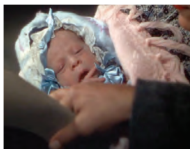
Figs. 37 y 38. Tres padrinos ( Three Godfathers , John Ford, 1948).