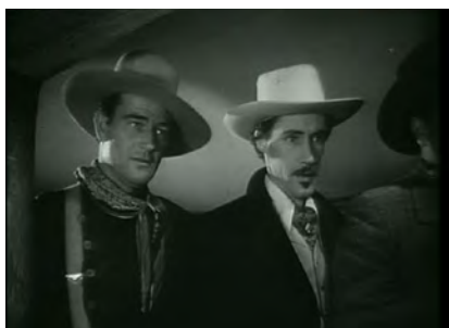
Figs. 1 y 2. La diligencia ( Stagecoach , John Ford, 1939).