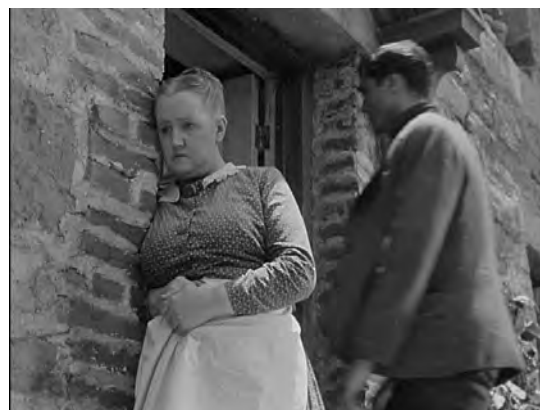
Figs. 8 y 9. ¡Qué verde era mi valle! ( How Green Was my Valley , John Ford, 1941).