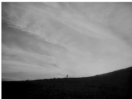
Fig. 14. Las uvas de la ira .

Mary O'Donnell (Maureen O'Hara), esposa de Marty Maher (Tyrone Power), sempiterno instructor de la tradicional y prestigiosa academia militar West Point en Cuna de héroes ( The Long Gray Line , 1955), encarna a la figura de la madre frustrada. Comparte con las anteriores la