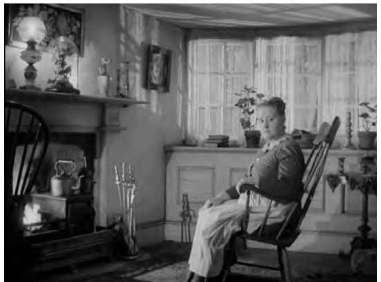
Figs. 12 y 13. ¡Qué verde era mi valle!