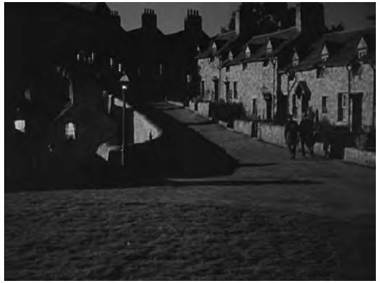
Figs. 10 y 11. ¡Qué verde era mi valle!

por un manto negro que evoca claramente la iconografía de la Dolorosa en el trance de perder al fruto de su vientre [Fig. 10]. En el preciso momento en que el coro entona la frase « God save our Queen » —«Dios salve a nuestra reina» y, por extensión, a nuestra madre—, la cámara se desplaza a la derecha para mostrar a los dos jóvenes enfilando apresuradamente la escalinata, en un plano general que los aparta para siempre de la mirada de su progenitora [Fig. 11].