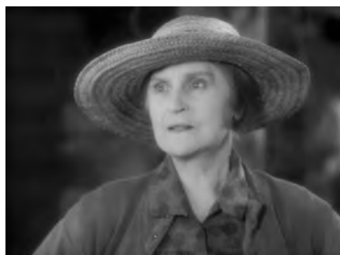
Fig. 28. Peregrinos ( Pilgrimage , John Ford, 1933).

Al inicio del relato, Ford reserva a Hannah el primer plano corto de la película para subrayar una mirada ambiguamente ansiosa hacia el joven mientras este trabaja en el huerto [Fig. 28]. Poco después, equiparará las miradas entre los amantes Jim y Mary con las del muchacho y su madre, en un inusitado empleo de la interpelación a cámara que rompe las reglas de transparencia propias de la enunciación clásica. Los jóvenes se encuentran frente a frente en el arroyo y el deseo que sienten el uno por el otro queda patente en sus respectivos primeros planos, en los que ambos miran directamente a cámara desde el punto de vista subjetivo del otro [Figs. 29 y 30]. La misma articulación de miradas se repetirá entre Hannah y Jim cuando, sentados a la mesa tras la cena, ella lea un pasaje de la Biblia advirtiéndolo a su hijo contra