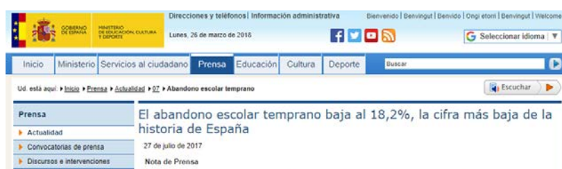
Figura 3. Noticias sobre AET