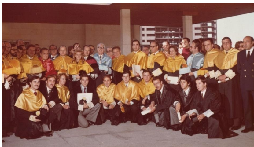
Graduación la promoción de la Facultad de Medicina de la Universidad Autónoma de Madrid en 1974.