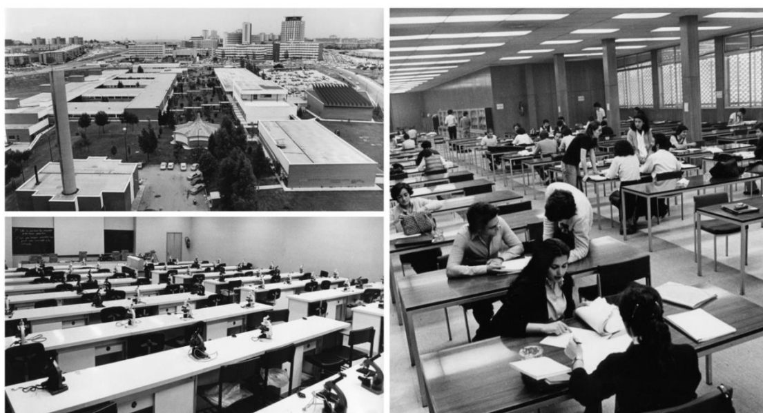
Facultad de Medicina de la Universidad Autónoma de Madrid en 1974. Vista aérea, sala de microscopía óptica y biblioteca.

Se creó la Mesa de Hospitales, con acreditación de estos para la formación de especialistas. Se ensayó el modelo en la CUPH, la FJD, el Hospital Central de Asturias, La Clínica Universitaria de Navarra y algunos más. Y bajo la sabia dirección de este equipo humano se pasó del sistema de formación de postgrado de cada hospital a un Sistema Nacional denominado como "Sistema MIR", inicialmente dependiente del Instituto Nacional de la Seguridad Social, posteriormente INSALUD y finalmente suscrito por la Universidad Española.