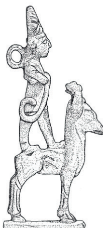
Figura 3: Figurilla de plata que representa a una deidad sobre un ciervo, hallada en Kalavassos-Hagios Demetrios (Chipre). (Genz, H., 2011, "Foreign Contacts...", p.308.)

Otros cuatro objetos en forma de figurillas 56 parecen ser regalos diplomáticos, al ser considerados imágenes de culto, cuya producción y circulación estaba limitada a los circuitos oficiales. Estos son una figurilla de plata con una deidad que porta vestimenta típicamente hitita y un casco con cuernos, sobre un ciervo, de Kalavassos-Hagios Dhimitrios 57 ; una figurilla de bronce; la cabeza de una figura en terracota; y la cabeza de terracota de un toro, de procedencia hitita y hallada en la necrópolis de Agia Paraskevi, cerca de Nicosia 58 , datada en el s. XIII a.C.