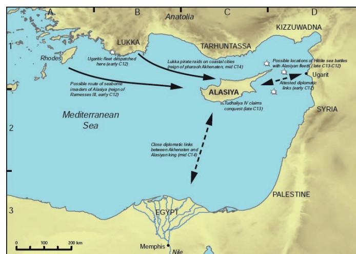
Figura 1: Mapa de Alasiya, con los diferentes ataques de los hititas y otros pueblos invasores. (Bryce, T. y Birkett-Rees, J., 2016, Atlas... , p. 147).

quienes les habían arrebatado el control de la zona minera de Ergani Maden, en el sureste de Anatolia. Tudhaliya, por lo tanto, debía asegurarse que las rutas comerciales, de las que dependían para suplir al reino de grano y de materias primas, continuaban accesibles. Esta campaña fue la primera batalla naval hitita de la que se tienen registros; y para ésta, Tudhaliya, sin duda, contaba con el apoyo de sus vasallos de Ugarit 16 y de Amurru quienes disponían de una flota. Aunque Tudhaliya IV se aseguró, temporalmente, de establecer un régimen prohibido en la isla; sin embargo, su control sobre el reino fue efímero ya que su hijo, Suppiluliuma II, se vio obligado a realizar tres incursiones navales, y otra batalla final en tierra para recuperar el control del reino insular 17 , y de una ruta comercial segura para el reino, que sufría varias hambrunas 18 . Sin embargo, esta victoria resultó igual de efímera que la de su padre, ya que Ḫatti y Alasiya 19 fueron invadidos por los Pueblos del Mar.