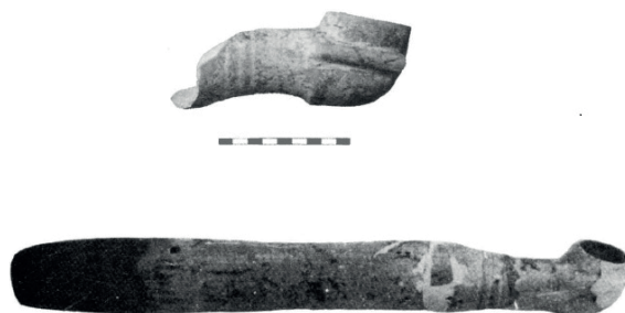
Figura 4: Cerámicas “Red Lustrous Wheel-made Ware” en forma de brazo, halladas en Boğazköy (superior) y Alaca Höyük . (Mielke, D.P., 2007, “Red Lustrous...”, p.157.)

Los fragmentos cerámicos hallados Ḫattuša se distribuyen tanto por la ciudad alta como por la ciudad baja; especialmente como relleno de los estanques de la ciudad alta, próximos a los templos, lo que sugiere que esta cerámica estaba destinada a las actividades relacionadas con el culto. Aunque los textos hititas no hacen mención en ningún momento a esta cerámica y tampoco adoptaron ningún ritual procedente de Alašiya; Mielke 65 cree que estarían presentes en las ceremonias de los templos hititas y podrían destinarse a ungir con aceite a las estatuas o personas. En un extensivo estudio sobre la cerámica “Red Lustrous Wheel-made Ware” realizado por Knappett et al. , 66 se comprueba que una parte de esta cerámica en Boğazköy se trataba con cera de abeja, lo que probaría que contenían líquidos; aunque el estudio no puede aportar más datos acerca de si estas cerámicas eran tratadas antes, o después, de su llegada a la capital hitita.