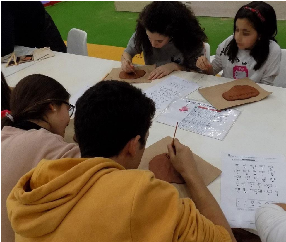
Figura 2: Actividades con fichas didácticas en el taller de “La escritura en la Antigüedad”.

Todas las actividades se componen de una breve introducción teórica, la práctica de la actividad por parte de los participantes y el trabajo de los conceptos mediante fichas didácticas (Fig. 2), fomentando el aprendizaje significativo 8 (Ausubel, 2002; Gatt 2003; Kim et al. 2018). La sensación de realizar tareas propias de otras épocas a las que no está acostumbrado suscita en el alumno una motivación que es imprescindible para fijar los conocimientos adquiridos (p. ej. Ausubel 2002; Shernoff y Hoogstra 2001; Carrillo et al. 2009; Kim et al. 2018). Por ello, estas actividades didácticas constituyen un recurso ideal para complementar el aprendizaje de cualquier asignatura.