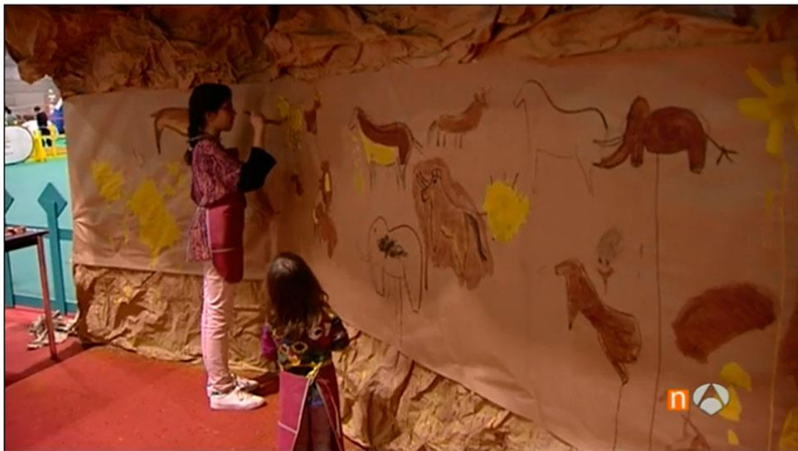
Figura 5: Cobertura informativa de los talleres arqueológicos de Juvenalia en diferentes medios de comunicación. En la imagen superior, informativos de la 1 de TVE; en la imagen inferior, Antena 3.