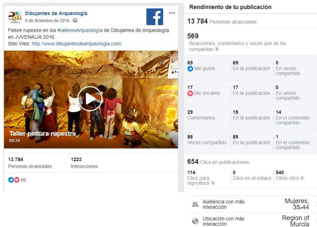
Figura 4: Datos sobre el alcance orgánico y rendimiento obtenido con el video del taller de “Pintura rupestre” publicado el 8 de diciembre de 2016 en el canal de Facebook de Dibujantes de Arqueología (2016).

Empleando diversos formatos (textos, imágenes y videos) y diferentes canales (Twitter, Facebook, Google Plus, YouTube y nuestro propio sitio web 10 ), cabe destacar el alcance orgánico logrado especialmente en Facebook 11 , y particularmente con la publicación del video sobre el taller de “Pintura rupestre”, que tuvo una gran interacción (sobre todo, entre mujeres de 35 a 44 años) y fue muy compartido (Fig. 4).