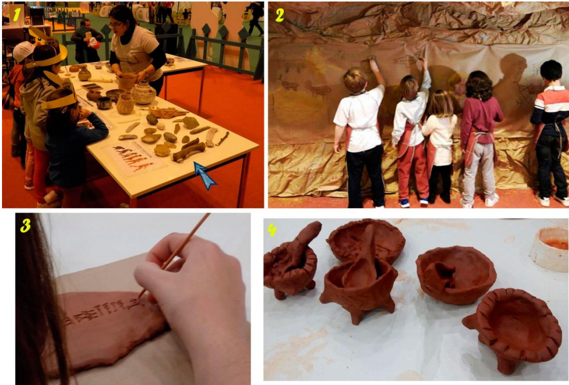
Figura 3: Imágenes de algunos de los talleres desarrollados en Juvenalia por Dibujantes de Arqueología: 1- “La línea del tiempo”; 2- “Pintura rupestre”; 3- “La escritura en la Antigüedad” y 4- “Cerámica prehistórica”.

En el taller de “Cerámica prehistórica”, tras una breve explicación de la actividad, los participantes examinan y tocan algunas reproducciones de cerámica prehistórica y después proceden a la fabricación de un pequeño cuenco de arcilla. En esta actividad se desarrolla la paciencia y la psicomotricidad fina. Además, la realización de un cuenco a mano mediante la técnica de “churros” con un material plástico sobre el que pueden corregirse los errores, ayuda a valorar el trabajo artesanal manual. Durante esta actividad se reflexiona sobre el aprovechamiento de los recursos naturales en relación con una de las aportaciones tecnológicas más importantes de la Historia de la Humanidad. Esta actividad tuvo un gran éxito en las dos ediciones, pese al miedo de los padres a las manchas de la arcilla. En la sociedad actual, una persona puede crecer sin apenas hacer cosas con las manos y ciertas capacidades pueden estar perdiéndose (García-Marín y Fernández-López 2020:34). Quizás este sea uno de los motivos por los que los niños adoran trabajar con la arcilla, aparte de que sea un soporte que estimula la creatividad y la manipulación. Elaborar un cuenco con unas técnicas concretas, estimula la meticulosidad y también la creatividad al observar las posibilidades que esa técnica ofrece.