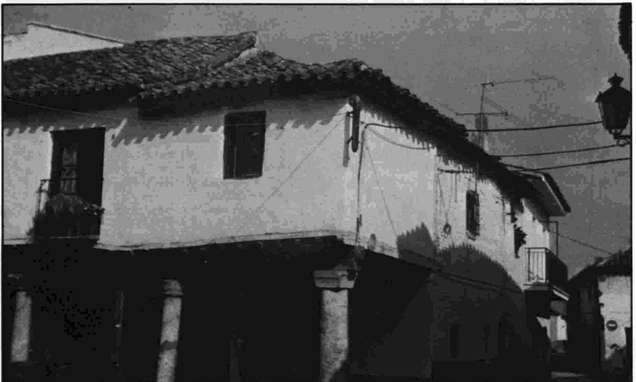
Plaza Mayor de Escalona

Las calles, estrechas y bien pavimentadas, se disponen alrededor de la Playa Mayor que constituye el centro principal de la vida cotidiana.