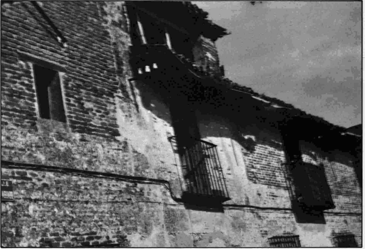
Típica casa de ladrillo en Escalona.

Los materiales más utilizados como elemento constructivo son el ladrillo, y la piedra en menor proporción. En la parte inferior de las fachadas suele disponerse la piedra y en el resto el ladrillo, aunque también hay casas enteramente de piedra o de ladrillo.