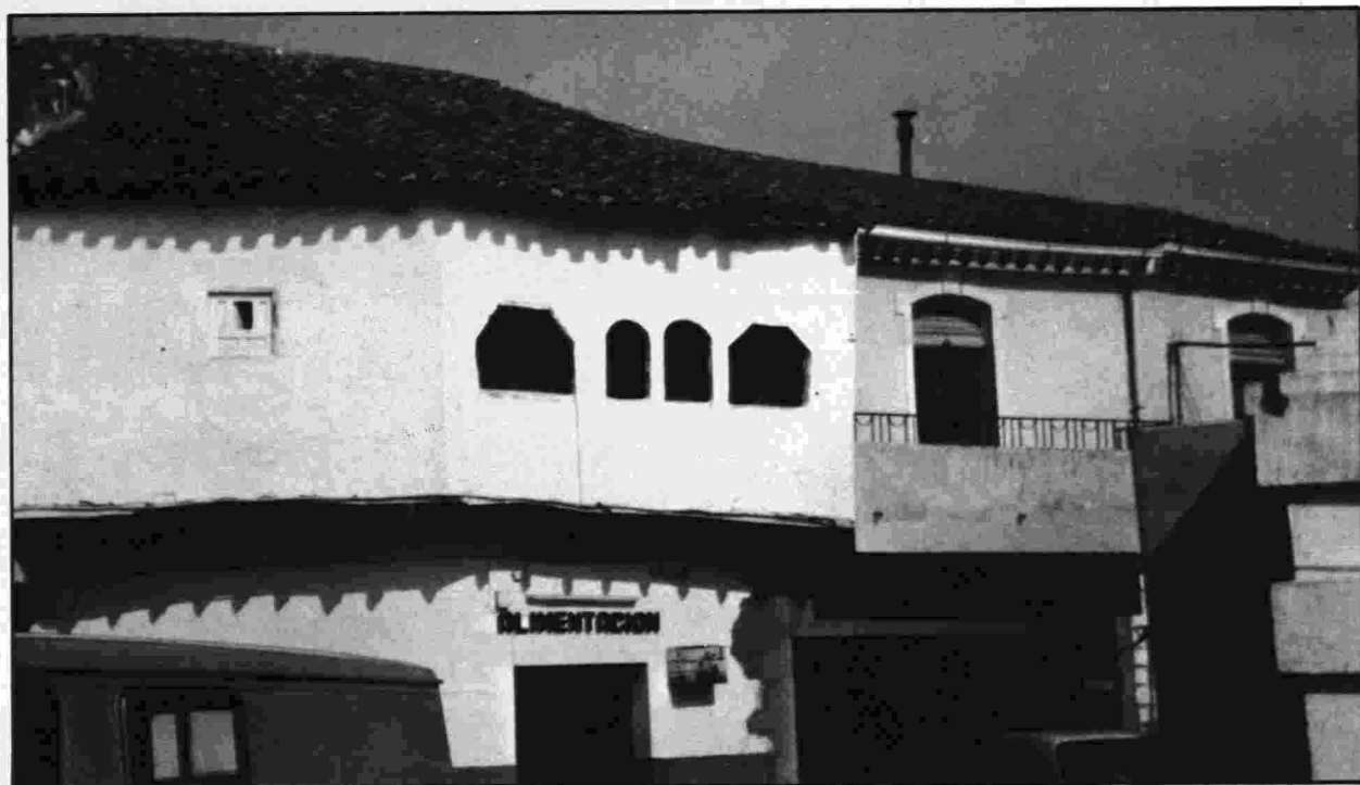
Influencia mudéjar en las ventanas de una casa del pueblo de Escalona.

En general, y a pesar del creciente turismo que últimamente va invadiendo la comarca, atraído por el Alberche y la proximidad de la Sierra de Gredos, el carácter popular no ha desaparecido de la arquitectura, y aún cediendo paso a la nueva tecnología,