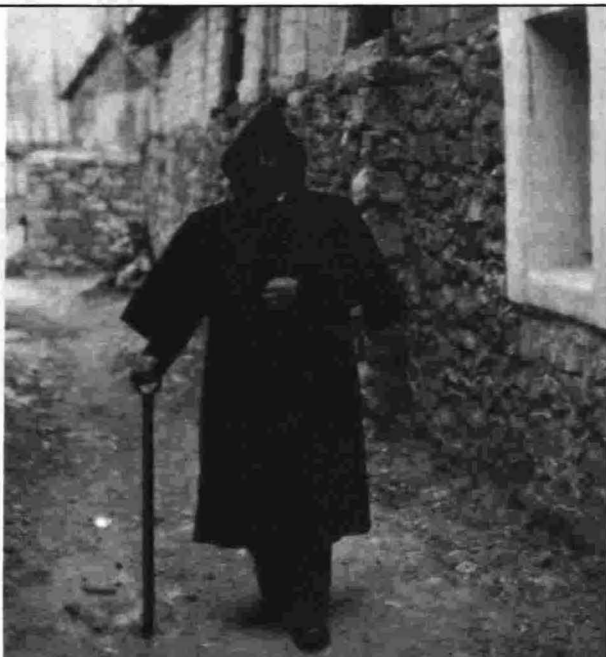
Capa de Fuentcaliente del Burgo.

que se colocaba interiormente en las bocamangas. Todavía la usan hoy los pastores en tiempo de invierno. (5)