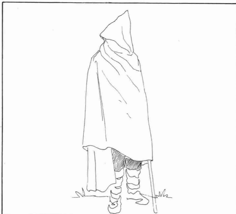
Capa blanca de Villaciervos.