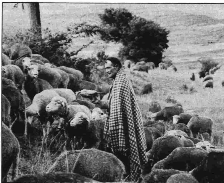
Manta de pastor soriano

Esta capa de color pardo ha sido empleada también en otras zonas pero con frecuencia encontramos textos que nos dicen que se ha utilizado más como prenda de lujo, o en días señalados que para protegerse de las inclemencias del tiempo.