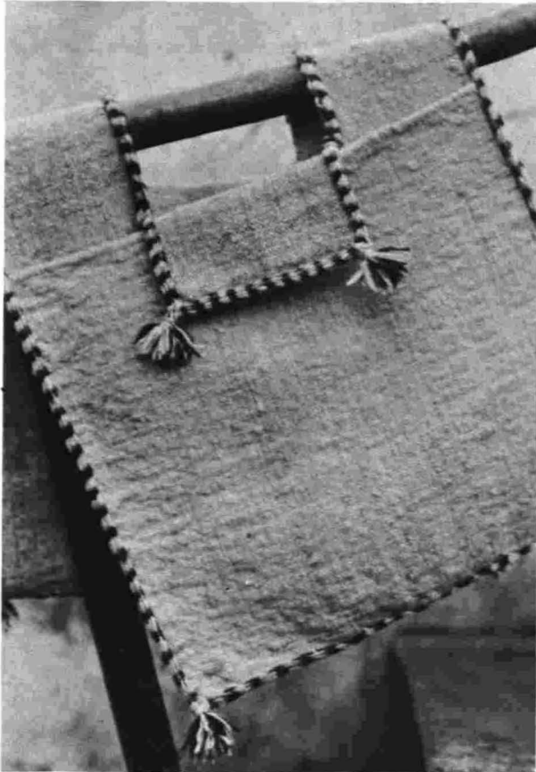
Alforja de lana.

Esta variación del número de hebras tanto en la urdimbre como en la trama es para los tejidos de lana y la combinación de la urdimbre y la trama da un tejido liso, que se consigue pasando la lanzadera de un extremo a otro del telar. Estos tejidos se hacen con una sola lanzadera.