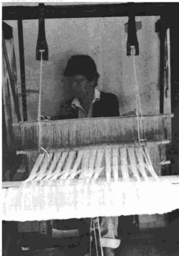
Tejedora de El Cercado - Chipude.

Estas madejas se colocan en la devanadera para hacer los ovillos con los que se llenan las canillas o "cañuelas" que se introducen en la lanzadera. Estas canillas se llenan en la "reina" o pieza de madera formada por un palo horizontal con una rueda en la parte central y en uno de los extremos del palo se introduce la caña para hacer la canilla al ir dando vueltas.