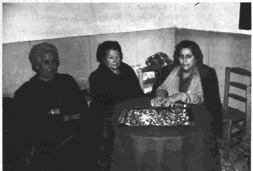
«Peñas» con el «puñao». Villanueva de los Infantes.

En la actualidad esta localidad continúa celebrando esta fiesta que consiste en instalar varias cruces, unas dos o tres, ya que es una localidad muy pequeña, solamente cuenta con unos cuatrocientos habitantes. Estas se encienden a las dos de la tarde del día 2 de mayo y permanecen encendidas hasta el día tres. Se reparte el “puñao” a las personas que acuden a visitarlas, como es tradicional y se canta el mayo a la cruz. Debido a las pocas personas que hay en esta localidad los mayos no se cantan todos los años, solamente cuando hay personas que sepan cantarlo. La letra de los mayos de la Cruz es la tradicional y en ella como es habitual se describe la vida y pasión de Cristo, terminando con la folía o parte final dedicada a los dueños de la casa en que se ha cantado el mayo.