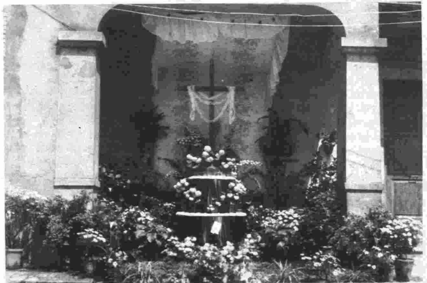
Cruz de mayo. Fuencaliente.

El amor se refleja en las canciones de ronda que cantan los mozos a las mozas y en las citadas enramadas que