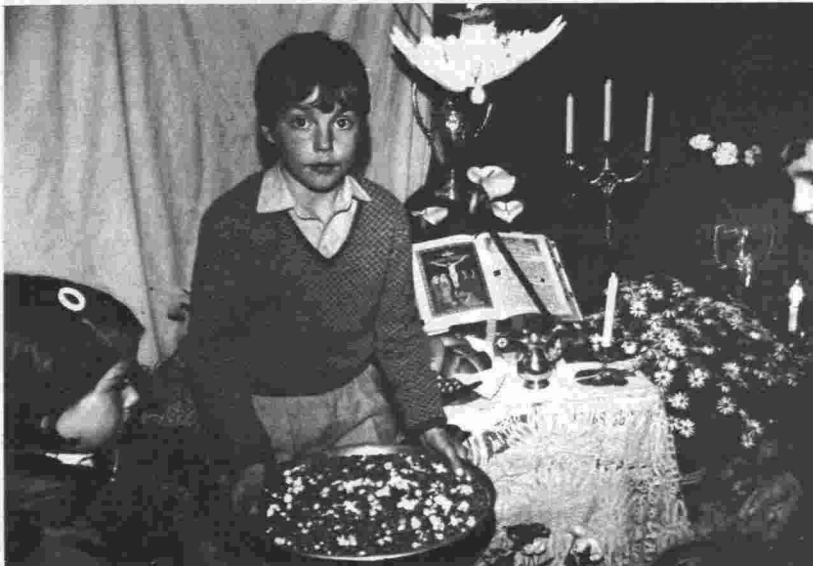
Niño repartiendo el «puñao» en una cruz particular. Villanueva de los Infantes.

Esta fiesta de Villanueva de los Infantes se encuentra en pleno apogeo y podemos decir que es uno de los pueblos que mejor la conservan de la provincia. El gran número de habitantes hace que se instalen muchas cruces, hecho que no sucede en otros de pocos habitantes en los cuales solamente se instalan dos o tres cruces y únicamente tienen una cuadrilla de mozos para cantar los mayos o ninguna como sucede en Fuenllana donde el cantar los mayos a las cruces depende de que haya gente para cantarlos o no.