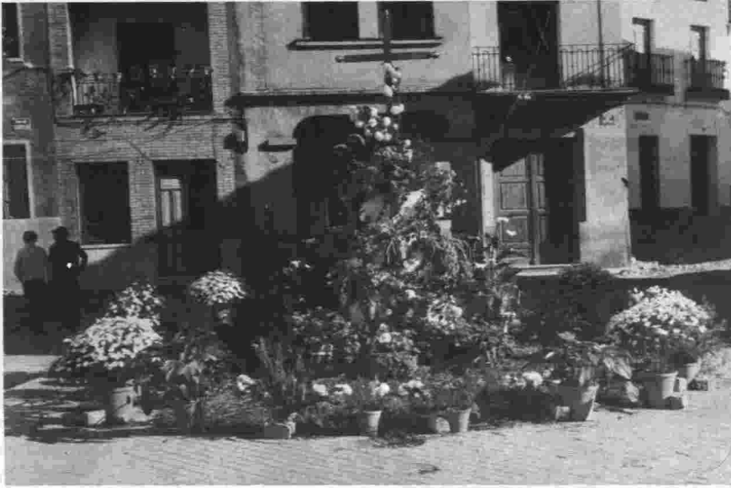
Cruz de mayo instalada en la calle. Fuencaliente.

tas de mayo es antiquísima. Parece ser que tuvo su origen en tiempos paganos, siendo más tarde cristianizada por la iglesia. A pesar de ser de origen antiguo, Melé asegura que son en cambio muy tardíos los indicios de ellas que pueden encontrarse. (2)