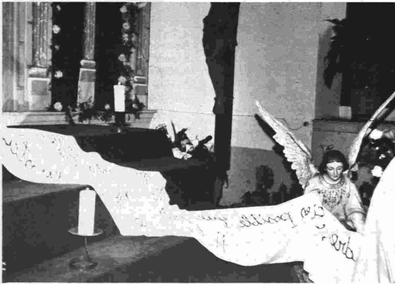
Detalle de una cruz. Villanueva de los Infantes.