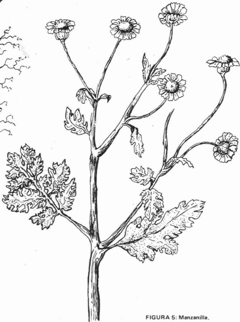
FIGURA 5: Manzanilla.

En ocasiones, sobre el estómago se colocaba un emplastro (denominados "sinapismos" y "reparos") de salvado