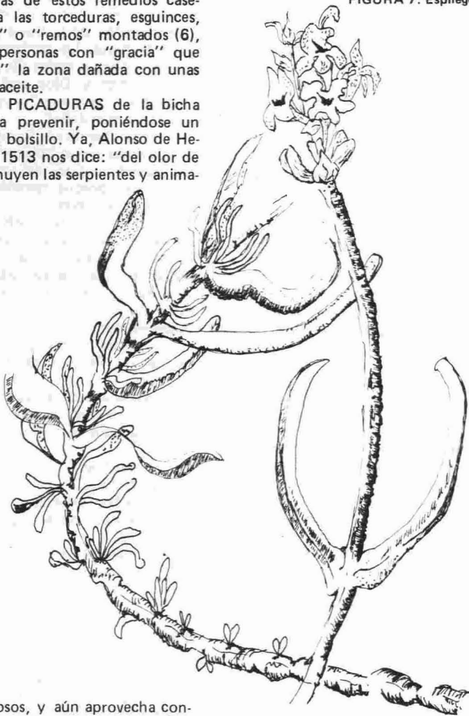
FIGURA 7: Espliego.

— Las PICADURAS de la bicha se van a prevenir, poniéndose un ajo en el bolsillo. Ya, Alonso de Herrera en 1513 nos dice: "del olor de los ajos huyen las serpientes y anima-