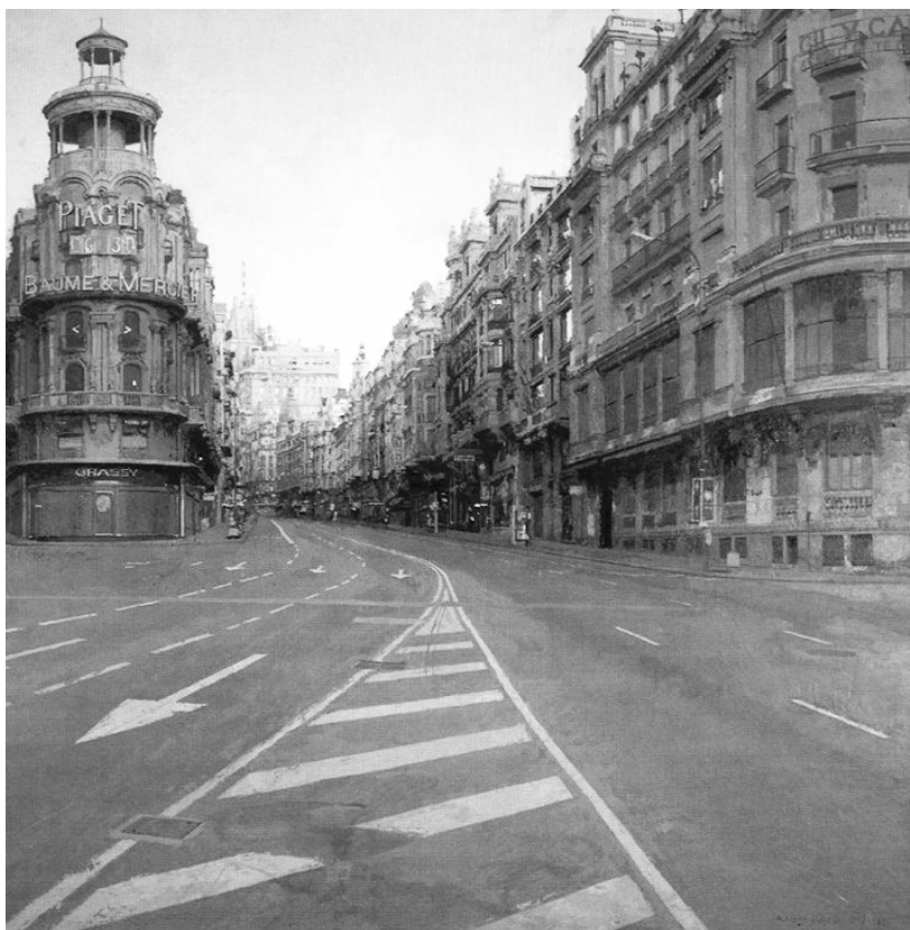
Gran Vía (Antonio López, 1974-1981).

de Víctor Erice y Abbas Kiarostami. La intención de Erice, que eligió e incluyó esta obra de arte de López, seguramente no era polémica: simplemente estaba investigando y exponiendo la génesis o el «aval» de su obra maestra El sol del membrillo (1992), incluyendo una serie de monitores a la altura de los ojos (que sólo comenzaban a proyectar cuando uno se acercaba a ellos) en los que se veían videos de «Apuntes» o «Notas». Estos bocetos –viendo al pintor trabajar, comparando las localizaciones en Madrid como él las presenta y como Erice las encuentra años después– presentan el trabajo preliminar (en imagen, sonido y palabras) del largometraje final y son puestos en relación con la presencia física de una pintura de López, ella misma dramatizada mediante la iluminación cinemática y la banda sonora. Pero el efecto para muchos visitantes de la galería era sorprendente: rara vez la visión de una obra convencional figurativa –si no hiperrealista– en un espacio expositivo había resultado tan extraña, io tan completamente desplazada de su lugar soberano habitual! (Por el contrario, la serie de fotografías de paisajes nevados en blanco y negro de Kiarostami, aunque excepcional, funcionaba de forma mucho más normal y «conciliadora» para los espectadores) 3 .