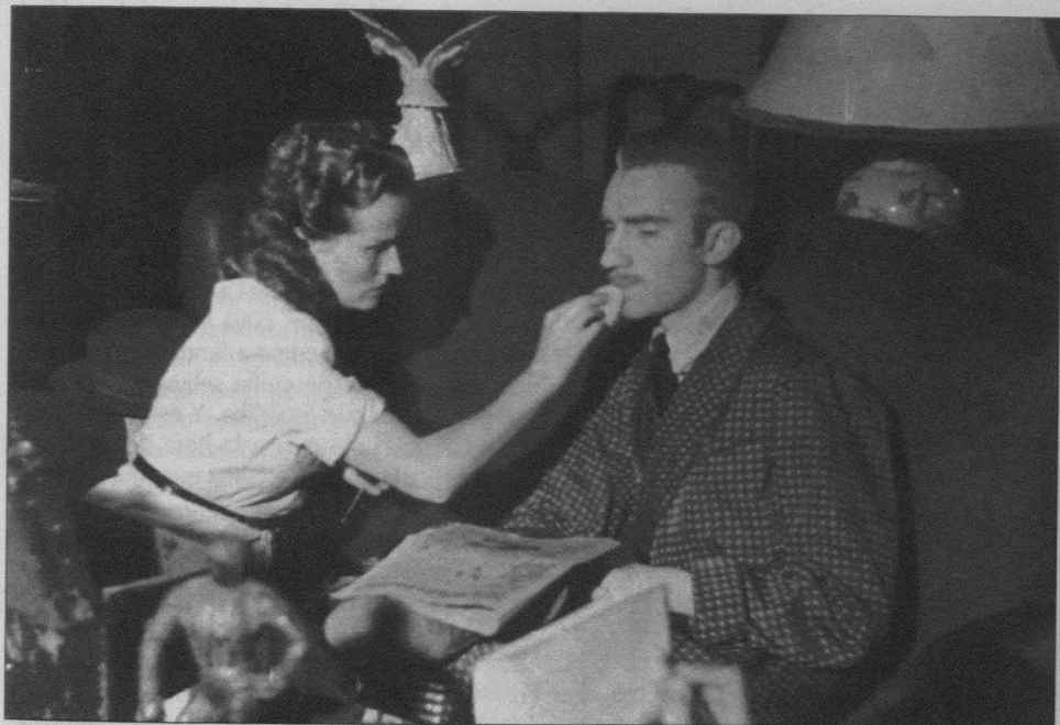
Maquillando a Fernán Gómez. En la segunda mitad de la película, la caracterización de C. Durán imita la del señor De Winter en Rebeca.

Cuando la criada se va regresa el ambiente descriptivo de los pensamientos y el estado de ánimo de Durán. La cámara le acompaña en sus movimientos, que también adquieren un segundo nivel de interpretación cuando Durán exterioriza su indecisión ante el cine asomándose al balcón y observando el rótulo de neón que se refleja en el cuarto, y que anuncia la película Rebeca . El tema musical que ilustra sus sentimientos contradictorios regresa hasta expulsarlo del balcón, momento en que otra interrupción vuelve a ceder paso al silencio de su pensamiento en favor de los comentarios de Clara, que le trae algo de cena en una bandeja y acaba haciendo un comentario sobre la esposa muerta de Carlos. Este hace una vez más referencia a su responsabilidad en la muerte de Ana. Ella quiere sacarle de la habitación para que cene con los demás, movimiento que también adquiere un valor simbólico al ser la mujer que le ama quien pretende arrancarlo de la habitación llena de sombras.