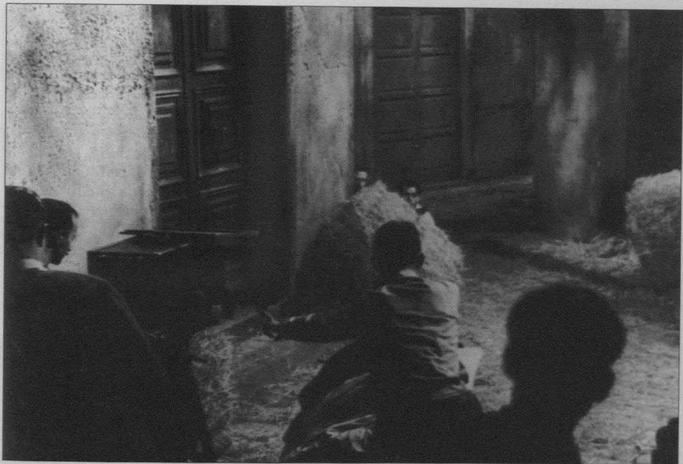
Rodando el enfrentamiento callejero al inicio de la guerra civil (s. 27).

otro sirve para hacer presente el embarazo de Ana, porque fue y es un antojo suyo. De aquí parte esta larga escena resuelta con un largo plano-secuencia. Carlos y Ana están cenando mientras la radio emite la realidad exterior, la histórica: comienza la Olimpiada Popular y se ha producido el levantamiento militar en Marruecos. Se ha sembrado ya la inquietud.