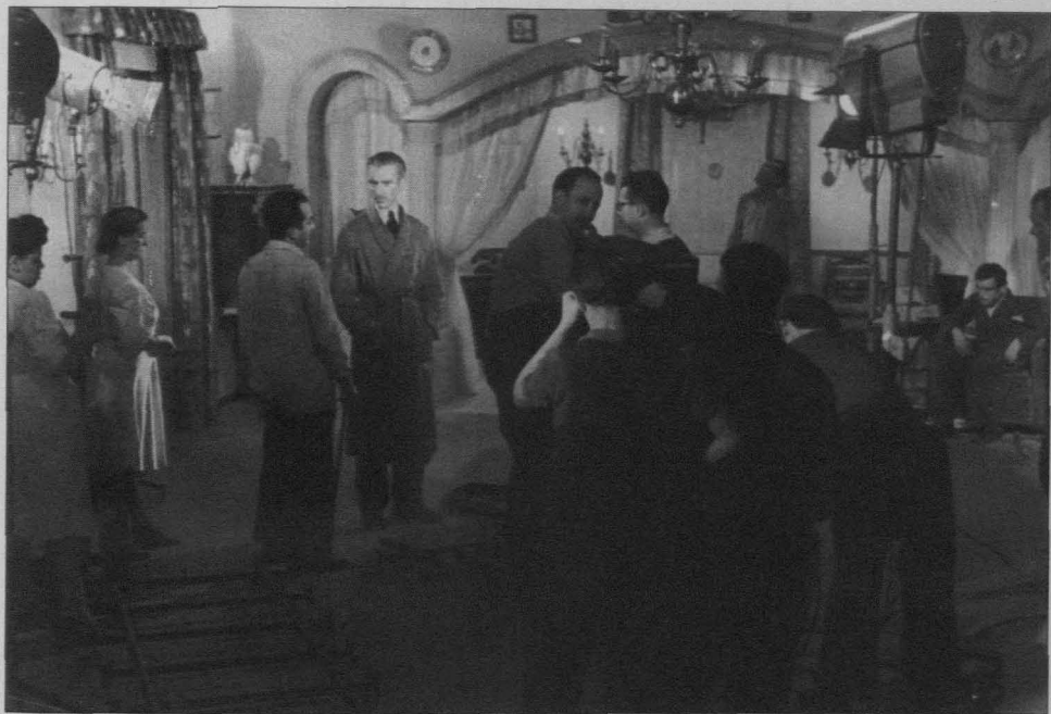
Preparando el rodaje en el decorado de la habitación de Carlos en la pensión en la que vive, una vez acabada la guerra.