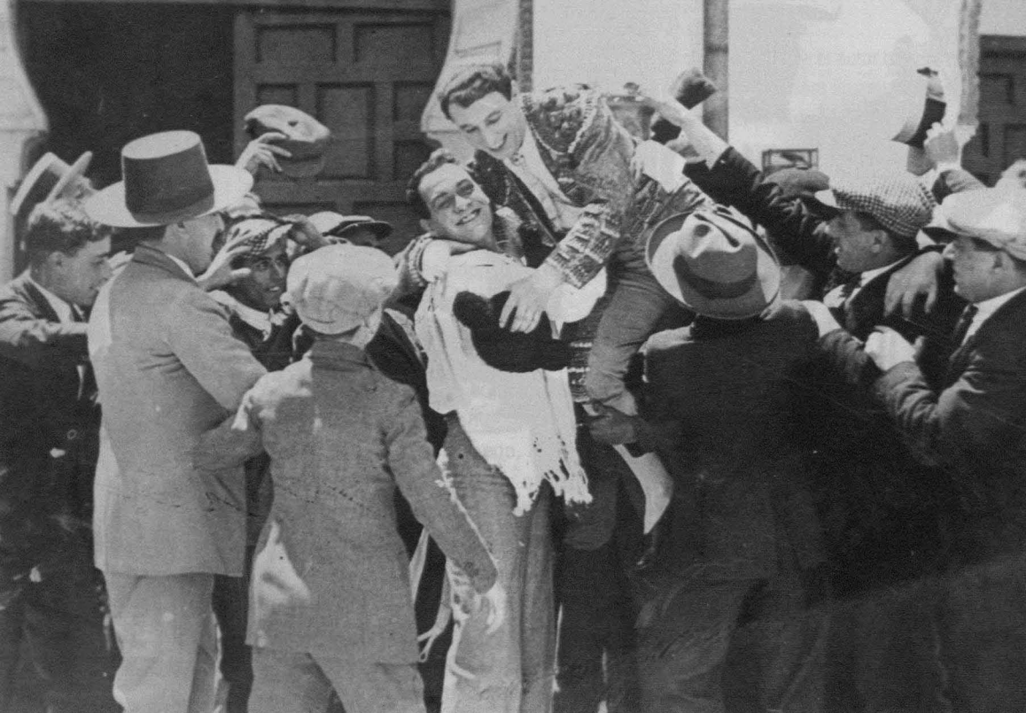
Currito de la Cruz, Alejandro Pérez Lugín, 1925.