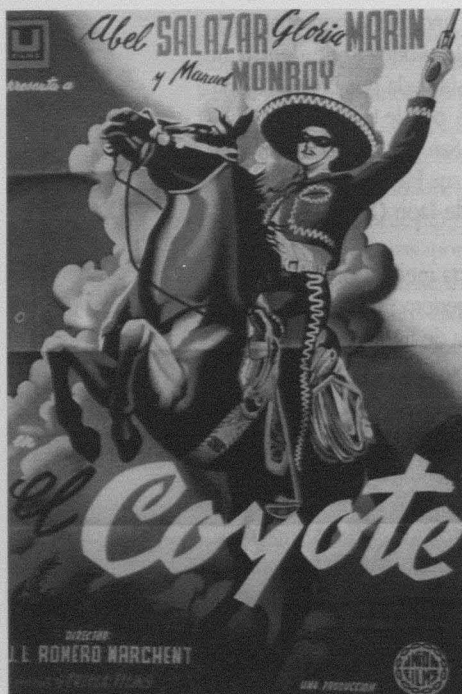
Cartel de El Coyote (Joaquín Romero Marchent, 1955).