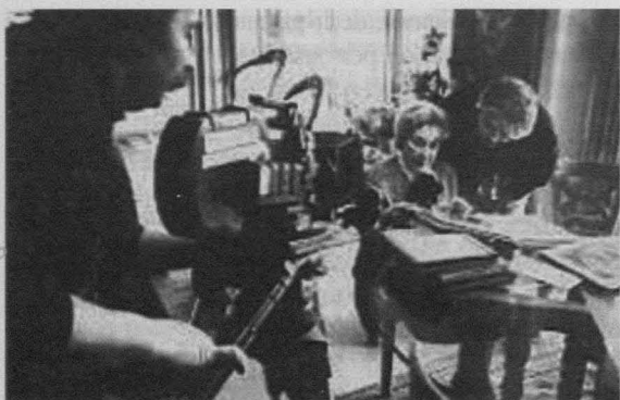
Patricio Guzmán entrevista a Hortensia Bussi, viuda de Salvador Allende, en La memoria obstinada (1997).

do del general Pinochet y la represión de la dictadura a través del relato de su propia experiencia del reencuentro con lugares y personas; Andrés di Tella para reconstruir una historia familiar que se imbrica en la historia de una Argentina enfrentada hoy al desvanecimiento de la esperanza. Y ambos recurren a las imágenes como depositarios de la memoria colectiva y como medios ineludibles para pensar cualquier realidad pasada y presente en la sociedad contemporánea, transitando aquel camino sin retorno que abriera y hollara desde los años cincuenta Chris Marker. Patricio Guzmán utilizará