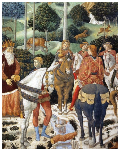
Fig. 7. Benozzo Gozzoli: La procesión de los magos (1459-1461), © Capilla de los Magos en el Palacio Medici-Ricardi (Florencia).

animales se muestran de frente al espectador, exactamente de la misma manera en la que Pausias tuvo que disponer sus figuras para lograr el deseado efecto de profundidad. En el Renacimiento se volvió a tener un interés importante en el tema del sacrificio en Roma y de su contexto cultural y político 50 . Se recuperaron las grandes escenas de sacrificio en relieves, arcos o monedas. De esta manera se emparejaban los conceptos de victoria y sacrificio.