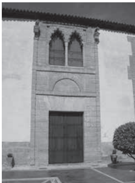
Fig. 3. Fachada del palacio de Pedro I de Astudillo (Palencia). Ca. 1354-1369.

Con un sentido más global, la configuración, en la Corona de Castilla, de diversas villas y ciudades –como Toledo, Burgos o Segovia, y