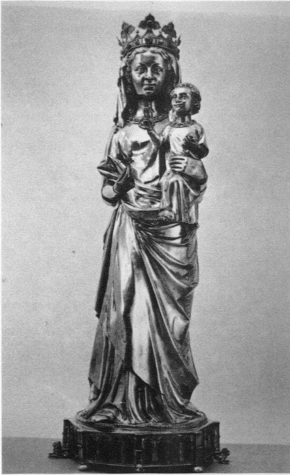
Fig. 1. Virgen con el Niño. Tesoro de la catedral de Aix la Chapelle. Hacia 1280

los hombros por dos cadenas de orfebrería 2 . De esta forma, se va produciendo una integración de lo que hoy consideramos distintas manifestaciones artísticas, que hay que encuadrar globalmente como imaginería, independientemente del material en que estén ejecutadas.