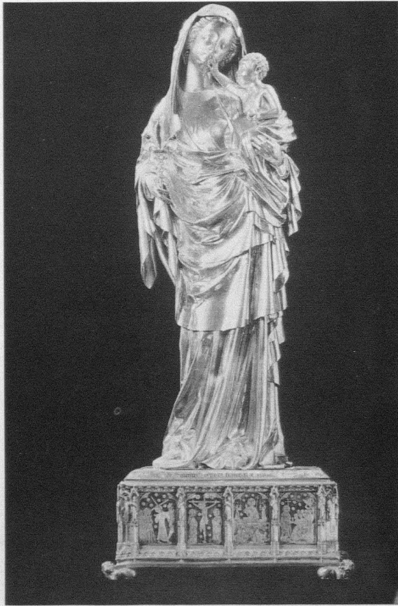
Fig. 7. Maternidad Dolorosa . Paris. Museo del Louvre. 1339

escultores de dar al rostro viril un cuerpo minúsculo para traducir la enseñanza teológica que afirma que el Niño Dios, desde su nacimiento, había poseído en toda su plenitud las facultades de la edad madura 10 . El grosor de las cabezas de la Virgen y el Niño encuentra su explicación en algunas doctrinas de la época. La cabeza, siendo la sede del alma, puede suministrarle una morada de una extensión variable y el desarrollo intelectual puede medirse sobre la extensión del lugar reservado a la inteligencia. Esta doctrina, extendida por algunos autores, sólo tuvo en la Edad Media una influencia pasajera. Más tarde, San Buenaventura formulará una nueva regla que llevará a la representación más reducida de la cabeza; la disposición de las partes cuyo conjunto forma el cuerpo humano, ofrece numerosas variedades, que interpretadas con arte, parecen corresponder a las diversas disposiciones del alma. El grosor de la cabeza, cuando es desmesurado, es un indicio ordinario de estupidez; la pequeñez extrema arrastra la ausencia de juicio y de memoria