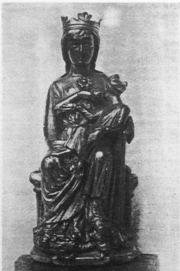
Fig. 3. María Lactans . Paris. Museo del Louvre. Siglo XIII

del valor simbólico de los emblemas que portan, que no sólo sirven de diversión al Niño, como la flor de lis (evocadora de la concepción virginal de Jesús), el tallo de Jessé, la vid que anuncia el sacrificio de la Pasión y la misa, el pájaro que significa el Espíritu Santo convertido en paloma o la corona que destaca su papel de reina soberana, reina de los cielos, como la han cantado poetas y místicos 4 . Los modelos también son limitados. La Virgen sentada o, con más frecuencia, de pie, sostiene en brazos a su Hijo en unas interpretaciones que parecen derivar de dos o tres tipos, repetidos al infinito, como ya señalara Lasteyrie 5 . Sólo la excepcionalidad de escultores y orfebres hacen sobresalir algunas de un mediocre anonimato.