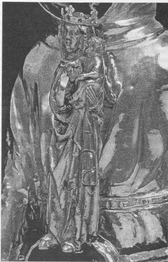
Fig. 16. Rey David y María Reina. Basilea. Historisches Museum . 1280 y 1320.

Es sobradamente conocido que las devociones ocuparon un lugar muy especial en el ámbito religioso, sobre todo a partir de un período avanzado del mundo bajo medieval, pero no lo es menos la ambivalencia de algunas piezas pues, con mucha frecuencia, la obra devocional lleva implícita la reliquia por lo que adquiere también la consideración de relicario. Esta doble función está presente en la mayoría de las obras y sin duda, en buena medida, la admiración que suscitaban en el pasado estaba vinculada a su capacidad milagrosa. Las capillas par-