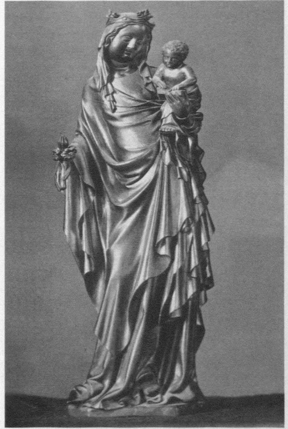
Fig. 12. Variante de la Virgen del Tintero. Florencia. Museo Nacional de Florencia. Col. Carrand . 1380-90

Sin duda, nos encontramos ante una temprana representación de una variación iconográfica de las imágenes de la Virgen con el Niño en cuyo origen e interpretación no todos los autores coinciden. Se trata de la Virgen con el tintero y el Niño leyendo o escribiendo. Parkhurst sitúa su aparición hacia 1380 en los Países Bajos, probablemente en Hainaut, desde donde penetraría rápidamente en casi toda la Europa Septentrional 24 . Para Squilbeck, el tema es algo más antiguo, hacia 1360 25 . Según