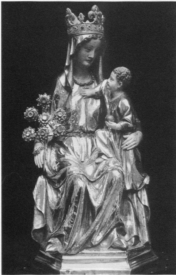
Fig. 5. María Lactans (pudorosa) . Roncesvalles. Colegiata. Principios s. XIV