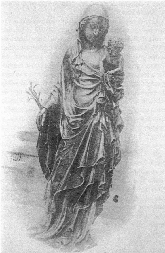
Fig. 9. Variante de la Virgen del Tintero. Paradero actual desconocido. Mitad del siglo XIV