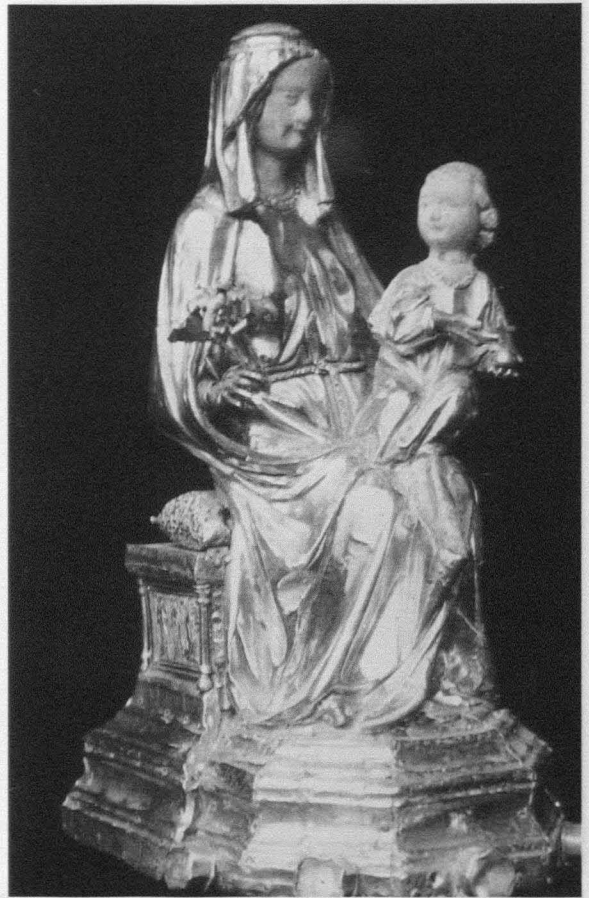
Fig. 6. Maternidad Gozosa . Roncesvalles. Museo de la Colegiata. Segunda mitad del siglo XIV

desde fines del siglo XII y se sitúan en el contexto de la emergencia de la escultura gótica. Desde fines del siglo XIII la Virgen como “Trono de Salomón”, puro pensamiento divino, deja paso a una expresión de sentimiento y ternura, en la que domina la idea de la Virgen como Madre del Niño Dios. No obstante, el modelo de Virgen Theotokos desarrollado a lo largo del siglo XIII, se mantiene hasta bien entrada la centuria siguiente 7 . La Virgen está sentada con el Niño centrado en su regazo o apoyado sobre su rodilla izquierda. Como atributo María suele llevar el cetro o la manzana, mientras el Niño bendice y sujeta el libro o el orbe. Un ejemplo de este modelo avanzado de Theotokos lo encontramos en la Virgen de Rocamador (Parroquia de Santa María de Sangüesa) de fines del siglo XIII- principios del XIV. Una imagen de madera enchapada de plata, en actitud frontal, coronada, con el Niño en el brazo izquierdo. Las manos derechas de los dos están rehechas por lo que desconocemos el atributo que portaba la Virgen, mientras el Niño, en ori-