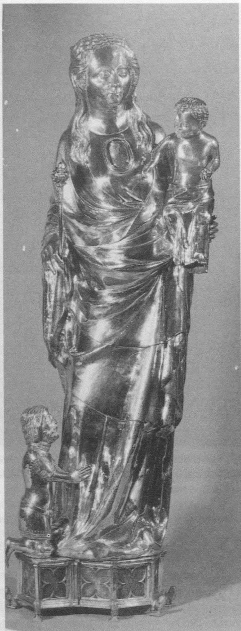
Fig. 13. Virgen con comitente. Aix-la-Chapelle, catedral. Hacia 1360