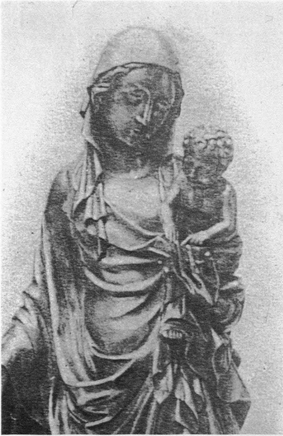
Fig. 11. Variante de la Virgen del Tintero. Paradero actual desconocido. Mitad del siglo XIV

o tal vez el cálamo. La cabeza, ligeramente girada, le permite observar atentamente al Niño, que lleva en su brazo izquierdo, al que mira con una expresión ciertamente melancólica. Con la mano sostiene un libro abierto en el que el Niño, siguiendo los renglones con los dedos, parece leer. Este, de formas regordetas y cabello ensortijado, muestra desnudo el torso, mientras la parte inferior del cuerpo está envuelta en una tela que forma un dobladillo horizontal sobre el vientre. Transmite perfectamente el carácter infantil.