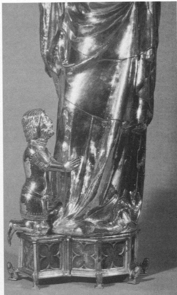
Fig. 14. Virgen con comitente. Aix-la-Chapelle, catedral. Hacia 1360

por una leyenda al camino de la cruz, que lleva en su pico el rótulo (Iglesia de los Carmelitas, Mayence, hacia 1390); etc.