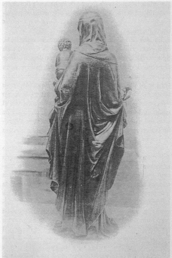
Fig. 10. Variante de la Virgen del Tintero. Paradero actual desconocido. Mitad del siglo XIV

brillante como el sol, es una aurora naciente 11 . Toda una serie de imágenes que se reflejan, especialmente, a través de las conocidas Letanías.