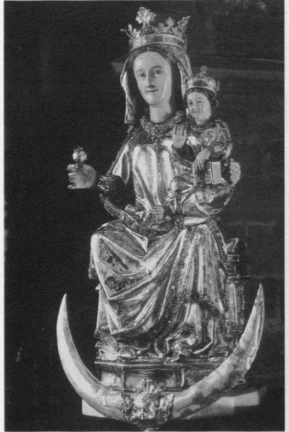
Fig. 2. Virgen de Rocamadour. Parroquia de Santa María de Sangüesa. Fines del siglo XIII-principios del siglo XIV

Otro aspecto importante a tener en cuenta son los modelos y la dependencia que se supone para la escultura preciosista de la de mayor formato. Sin embargo, la difusión de tipos y estilos en el siglo XIV se efectuó sin tener en cuenta los materiales. Probablemente resultó de la movilidad de los escultores así como de las obras y de la distribución general de pequeñas estatuillas en marfil o metal que pudieron servir de modelos. Seguramente, debido a la riqueza de materiales, muchas de estas piezas, en particular imágenes de la Virgen con el Niño que van a centrar nuestra atención, no se han conservado, pero su producción debió ser, según se deduce de los inventarios, al menos tan intensa como las realizadas en piedra.