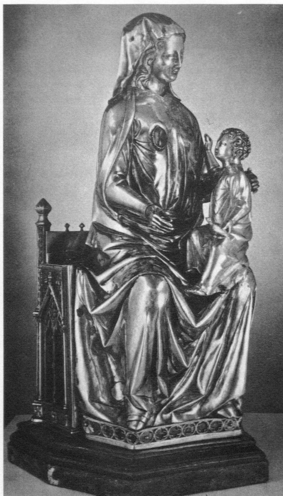
Fig. 4. María Lactans . Walcourt. Colegial de Saint Martene. Mitad del siglo XIII

De este modo, las esculturas en metal poco tendrán que envidiar a las devocionales en otros materiales, así como a las de los pórticos y tímpanos, añadiendo además, con frecuencia, su carácter funcional de relicario. Significativa en este sentido es, por ejemplo, la Virgen con el Niño del tesoro de la catedral de Aix la Chapelle,