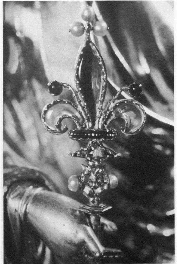
Fig. 8. Maternidad Dolorosa . Paris. Museo del Louvre. 1339

Una compilación atribuida a Hugo de San Víctor en el