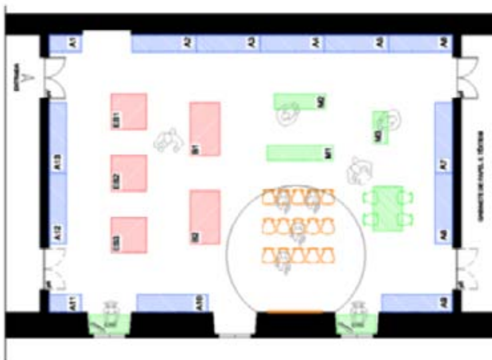
Fig. 1.2. Planta da reserva visitável da Química. Área de exposição (vermelho e azul), área de ensino (laranja); área de trabalho (verde).

A “área de ensino” evoca o segundo período histórico, durante grande parte do século XX, quando este espaço funcionou como sala de aulas teórico-práticas da Faculdade de Ciências da Universidade de Lisboa. Assim, pretende-se a recriação de um espaço de sala de aula a partir da recolocação do quadro de ardósia (original da Faculdade) e de um conjunto de cadeiras de modo a desenvolver atividades de igual natureza. Fica assim ligada a um público especializado de estudantes, profissionais de museus, bolseiros e voluntários, onde se desenvolve uma linha de formação na área da história da ciência, museologia e património. A “área de trabalho” que evoca o terceiro período (presente e futuro) em que o espaço assume uma função de cariz museológico no sentido da preservação, valorização e divulgação do património da Química. Neste sentido, funciona como local de trabalho museológico onde decorrem atividades de conservação, de inventário e de investigação da coleção. Esta área estará equipada com uma mesa de trabalho e duas secretárias com terminais de computador que possibilitem o acesso à base de dados da coleção. Está voltada para os funcionários e investigadores que desenvolvem trabalho de gestão da coleção e de aprofundamento da investigação.