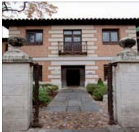
Fig. 1.- Fachada del Museo Casa Natal de Cervantes.

La entrada es gratuita y la apertura se realiza 6 días a la semana durante 8 horas ininterrumpidamente. Para complementar la visita se dispone de una publicación gratuita (a modo de guía breve), bilingüe desde el año 2009. También bilingüe es la página web del año 2004 que dispone de una visita virtual por todas las salas.