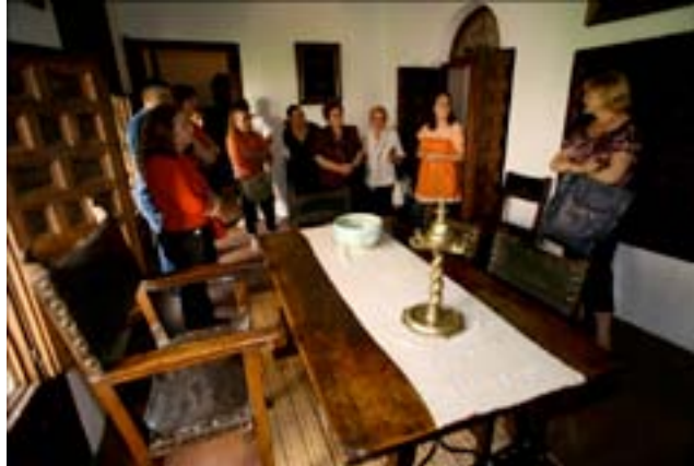
Fig. 4. Visitas guiadas a la Casa Museo Lope de Vega.

La Casa Museo Lope de Vega recibe anualmente una media de 20.000 visitantes que esperamos se supere durante el presente año ya que, desde su reapertura, la media ha ido ascendiendo unos 2.000 visitantes por año (19.143 en 2009 y 21.011 en el 2010). Hay que tener en cuenta que el museo abre 5 horas al día (de 10 a 15 horas), que las visitas se realizan cada 30 minutos y que por motivos de conservación, el acceso queda restringido a un máximo de 10 personas, por lo que no aspiramos a alcanzar grandes cifras de visitantes.