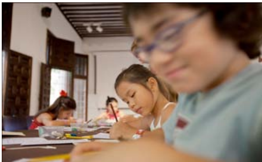
Fig. 6. Talleres de Verano.

Además del apoyo al teatro, una de las actividades más demandadas son los talleres de familia y de verano. Desde sus inicios han tenido una gran aceptación y el grado de fidelización fue tal (más de un 50% de los asistentes ya conocía el museo y/o había participado en nuestras actividades), que nos obliga a modificar constantemente los discursos. Actualmente estamos centrados en fomentar hábitos de lectura y de escritura en este tipo de iniciativas. La primera experiencia, en este sentido, se realizó en otoño de 2010 cuando ofrecimos los talleres “Hablar teatro”, una actividad conjunta al Museo Casa Natal de Cervantes. Pero fue nuestra última experiencia, el taller de verano “Aquí se escriben libros”, la que nos ha reafirmado en esta nueva orientación de nuestros contenidos didácticos. Los resultados de la evaluación nos mostraron un alto grado de satisfacción, sobre todo por parte de los padres y madres que vieron en este taller de escritura una labor necesaria que, por desgracia, no se lleva a cabo al 100% en los centros escolares con aquellos niños que presentan dificultades en esta área del conocimiento. Y es que los programas curriculares están viendo mermados estos contenidos, así como la lectura. Ante esta situación nos preguntamos si se nos está demandando a los museos educación formal como la que se imparte en los centros escolares.