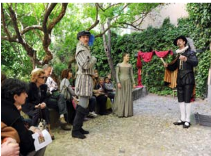
Fig. 5. Teatro. Día Internacional de los Museos.

Como ya se ha mencionado, las casas museos gestionadas por la Comunidad de Madrid, participan anualmente en actividades extraordinarias como La Noche de los Teatros, el Día Mundial de la Poesía, el Día Internacional de los Museos.... Todas estas fechas son un excelente pretexto para darnos a conocer. Es sabido por el personal de museos, que nuestras instituciones no generan noticias a diario, es por ello que necesitamos todo el apoyo por parte de los departamentos y gabinetes de prensa para que den a conocer nuestras iniciativas culturales. De este modo, en el año 2010, de todas las noticias que se recogieron en prensa escrita, radio y televisión en la Casa Museo Lope de Vega, casi un 71% correspondieron a aquellas relacionadas con estas actividades extraordinarias (La Noche de los Teatros un 35%, el Día Mundial de la Poesía un 22,5% y el Día Internacional de los Museos un 16,25% del total).