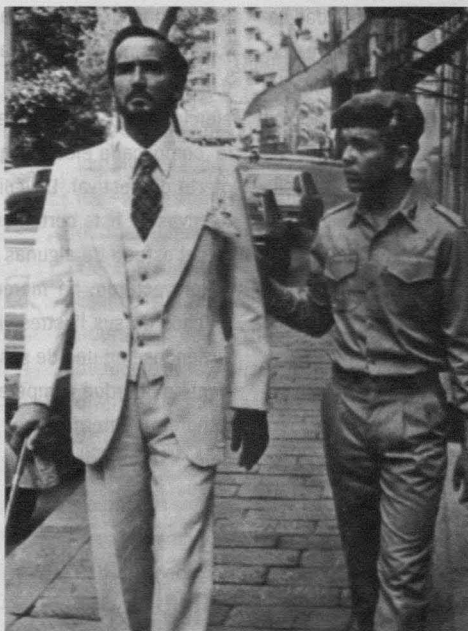
Perfume de mujer (Profumo di donna), Dino Risi, 1974.

la obra de Strati el cine de Tavemier supone un puen estado dentro de que implica la gran unidad de las refo- solo empuñada en las copias que el palacio de y va con distintos que ofrece el de festivales de