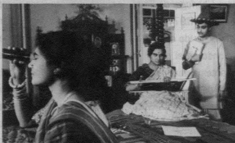
Charulata, Satyajit Ray, 1964.

Así, pues, con todo el respeto para el amigo Ángel, pero también con toda la franqueza que, convendrán conmigo, debe tener el juego intelectual, el contraste de ideas, me dispongo a plantear una réplica o a suscitar unas dudas a las que me ha inducido la lectura del texto de Quintana. Bien es cierto que, como muchas veces ocurre, puede que en el fondo él y yo estemos de acuerdo en todo y la discrepancia se deba únicamente al hecho de que el autor del artículo no haya sabido expresar sus ideas con todo el perfil de matices requerido. O, más probable aún, que el lector de aquel texto, esto es, quien firma estas líneas, no haya sabido encontrar estos matices y se haya sobre excedido en su voluntad de arrancar un debate cuanto más productivo y participativo mejor. Por lo que empiezo ahora mismo resumiendo mis dudas u opiniones en tres epígrafes.