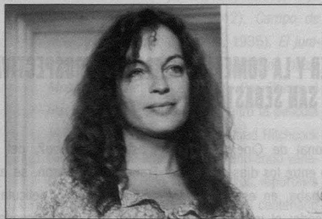
La muerte en directo ( La mort en direct ), Bertrand Tavernier, 1979.

Bertrand Tavernier ha sido este año un nombre indispensable para la muestra donostiarra: su obra pudo verse dentro de la retrospectiva contemporánea del festival; ejerció como Presidente del Jurado Oficial y presentó además su última película, Ça commence aujourd'hui (Hoy empieza todo), que