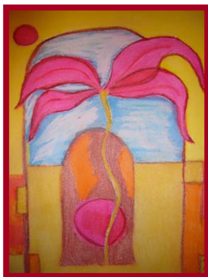
Figura 3. Dibujo realizado por una alumna talento en expresión plástica

7.- Sesión de arteterapia y relajación; dibujo musical. Escuchamos el álbum de Enya (Watermark) con una duración aproximada de 40 minutos. Se ofrece total libertad a los discentes para que dibujen aquello que les inspira esta música y lo plasmen en una cartulina utilizando cualquier tipo de material: témperas, rotuladores, lápices de colores, acuarelas, plastilina, papel celofán, ceras, purpurina, etc. Un ejemplo de este trabajo puede verse en la figura 3. Con esta actividad, nuestro propósito es dejar volar la imaginación, fomentar el desarrollo de la creatividad y la expresión libre del alumno a través de su relación con la pintura y la música. Para la realización de esta tarea, se establece una estrecha colaboración y coordinación entre las maestras de la asignatura de música y de plástica para trabajar de forma conjunta en el aula (enseñanza compartida). Las obras creadas se guardan para su posterior exposición en los pasillos del centro escolar durante la Semana Cultural del Centro próxima en el tiempo a esta experiencia de innovación (la música de Enya se encuentra disponible para su audición en la página del edublog titulada “Relajación y dibujo: Enya”).