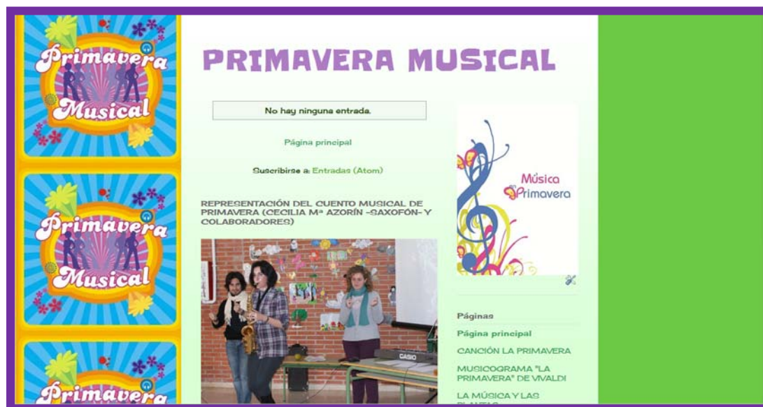
Figura 2. Captura de la página principal del edublog “Primavera Musical”

3.- Musicograma “La Primavera” de Antonio Vivaldi. Escuchamos la audición y seguimos el musicograma que se propone en el vídeo. Observamos que una misma melodía puede ser representada de diferentes formas mediante el análisis de distintos musicogramas de una obra musical. Posteriormente, cada alumno elabora su propio musicograma en un folio tamaño DIN A3 (esta información -musicograma, imágenes y vídeo- se encuentra disponible para su consulta en la página del edublog titulada “Musicograma La Primavera de Vivaldi”).