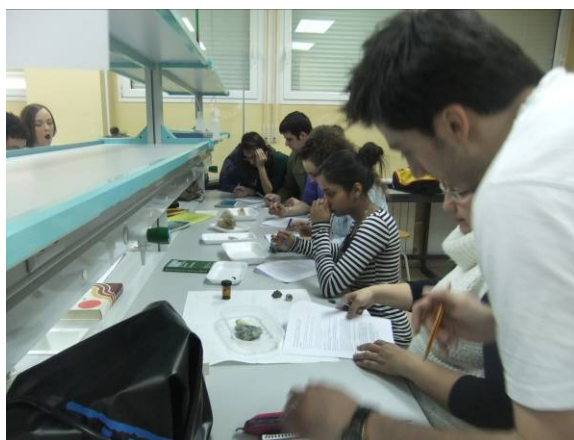
Fotografía 3. Alumnos trabajando en el rincón “Tocar, mirar, oler, saborear” donde los minerales se identifican fácilmente por propiedades organolépticas.

Ejemplos: se presentan ejemplares como la halita o sal gema que tiene sabor salado, la piritita que es llamativa por su brillo metálico, el talco que tiene un tacto jabonoso o el petróleo con un fuerte olor característico.