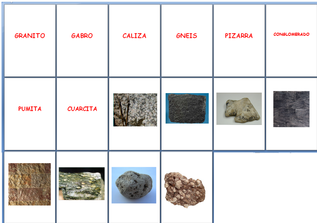
Fotografía 8. Cartas de elaboración propia para aprender y relacionar los nombres con las imágenes de las rocas.

De esta manera, el alumno relaciona la imagen con el nombre de la roca y posteriormente es capaz de identificar otras muestras similares en otros contextos (por ejemplo en el propio laboratorio con ejemplares de otras colecciones o en el campo).