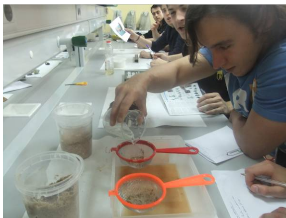
Fotografía 5. Rincón “de qué está hecho”. Diversos ensayos sencillos favorecen el aprendizaje de los conceptos de absorción y filtración.

Ejemplo: se pueden utilizar muestras de cinabrio, arena de cuarzo, bentonita, calcita, y relacionar estas muestras con los siguientes objetos: termómetro de mercurio, vaso de vidrio, “camas de gatos” y detergente.