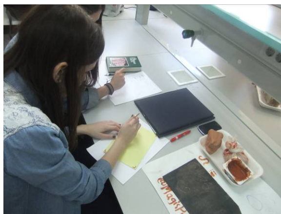
Fotografía 4. Rincón “a pintar”. Los alumnos aprenden el concepto de la raya de un mineral a través de su propia experiencia.