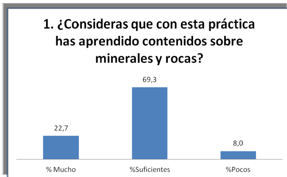
Gráfico 1. Porcentajes de respuestas a la primera pregunta del cuestionario de satisfacción.

En cuanto a la pregunta sobre la adecuación de la metodología de la práctica, los estudiantes participantes manifestaron su satisfacción respecto a la metodología seguida. Casi un 35% consideraron que había sido muy adecuada, un 64% señaló que había sido adecuada y solamente alrededor de un 1% respondió que había sido poco adecuada (ver gráfico 2).