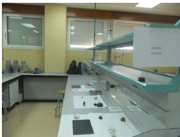
Fotografía 1. Detalle del espacio de trabajo en el laboratorio.

Cada uno de los dos grupos de prácticas se subdividió en 6 equipos de trabajo de unos 8 estudiantes cada uno que fueron rotando de un rincón al siguiente durante toda la sesión (de dos horas de duración total). Cuando la actividad comenzó cada grupo dispuso de 15 minutos, en cada rincón, para relacionar las muestras y sus características, resolver las preguntas y realizar las experiencias. La duración de cada rincón se ajustó rigurosamente gracias a la utilización de un cronómetro/temporizador a fin de disponer todos los equipos del mismo tiempo de trabajo. El número elevado de alumnos en el laboratorio hizo necesario dejar unos minutos para el cambio entre un rincón y el siguiente. La disponibilidad de los recursos y el material específico de los talleres en uno de los laboratorios del campus, exigía utilizar, para esta experiencia, este espacio singular. Sin embargo, su estructura mobiliaria con mesas corridas de trabajo se comprobó que no era la más eficaz para el trabajo por rincones (ver fotografía 1).