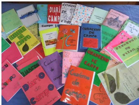
Fotografía 2. El propio diseño del cuaderno de campo favoreció la motivación en los alumnos.

El cuestionario buscaba conocer de forma breve las opiniones de los estudiantes. Constaba de cuatro preguntas, dos cerradas y dos abiertas que se detallan a continuación.