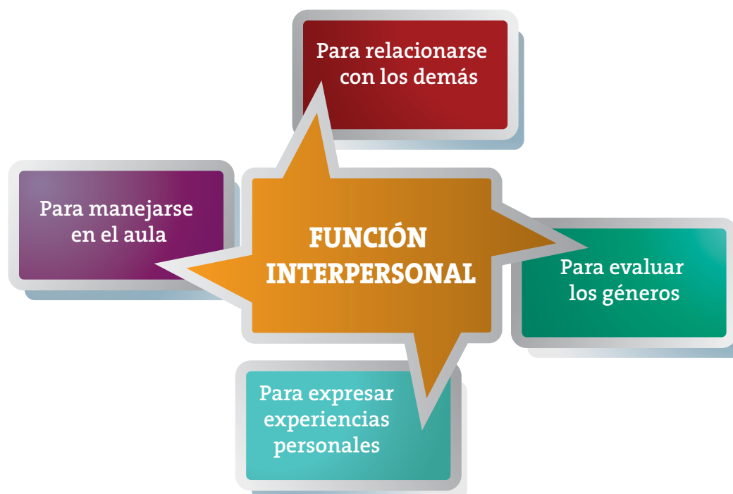
Figura 2. Funciones interpersonales del lenguaje en AICLE (basada en Llinares, Morton y Whittaker 2012)

La figura 2 muestra cuatro áreas en las que la función interpersonal es importante en AICLE. El aula de AICLE debe fomentar el uso de la función interpersonal para fines sociales. Esta función es especialmente relevante en un contexto como el nuestro en el que los alumnos sólo tienen la oportunidad de usar la L2 para esta función en el contexto del aula. Los estudiantes AICLE necesitan usar recursos interpersonales para expresar actitudes y juicios sobre los temas y géneros que estudian. También necesitan relacionar sus experiencias personales con los temas que aprenden y, finalmente, deben ser capaces de participar en las distintas actividades del aula en la lengua extranje-