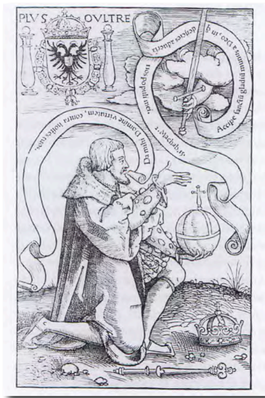
Fig. 3- Frontispicio del libro de Frans Titelmans, Elucidatio in omnes psalmos , Amberes, 1531.