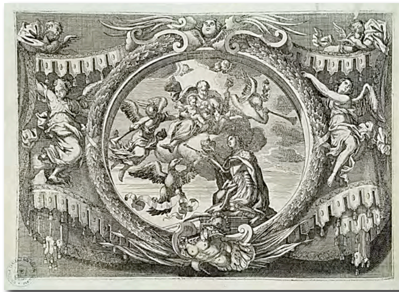
Fig. 12- Jeroglífico fúnebre en la relación de D. de Loya, Ocaso de el mejor sol en el occidente de Iberia... , Palermo, 1701