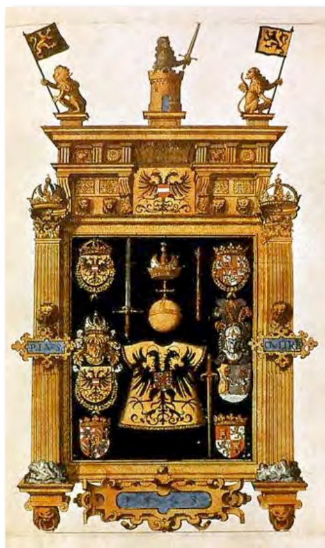
Fig. 2- Hieronymus Cock, Johannes y Lucas van Doetecum, entalladura para el libro La magnifique et sumptueuse pompe funèbre... , Amberes, 1559.