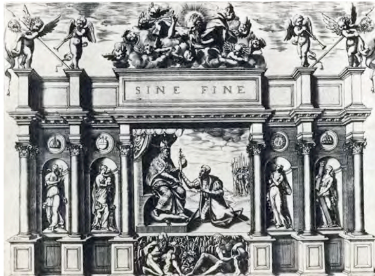
Fig. 7- Empresa de Gerónimo Ruscelli, Le imprese illustri , Venecia, 1566.