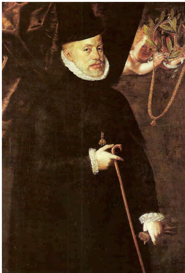
Fig. 14- Anónimo, Rey Felipe II . 1597, Berlín, Deutsches Historisches Museum.