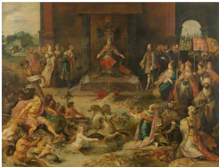
Fig. 5- Frans Francken II, Alegoría de la abdicación del emperador Carlos V el 25 de octubre de 1555, en Bruselas . Hacia 1620, Ámsterdam, Rijksmuseum.