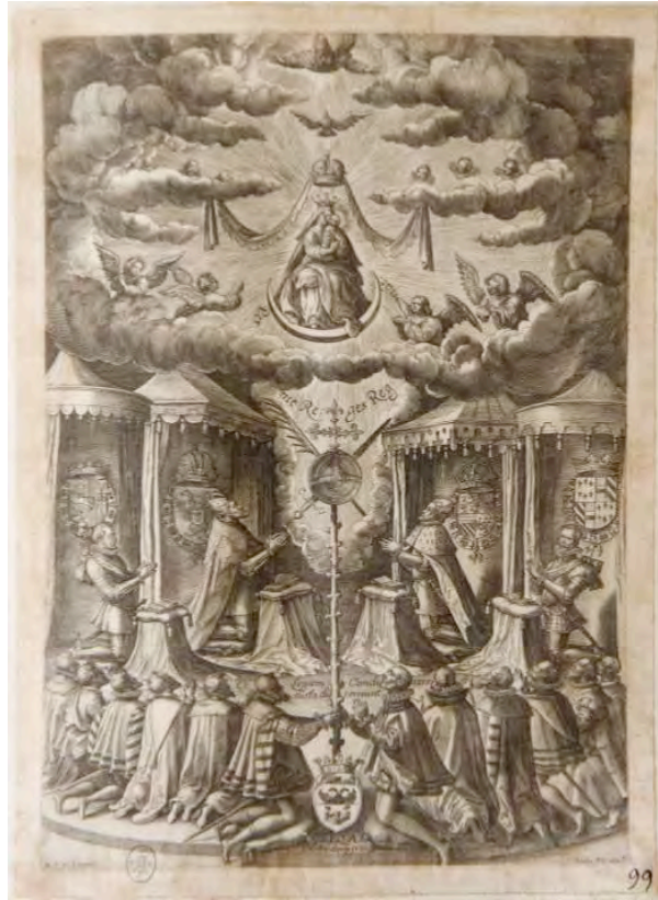
Fig. 11- Anónimo, Carlos V y Felipe II con la Virgen . Estampa, mediados del siglo XVI.