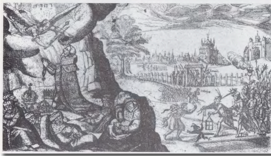
Fig. 15- Xilografía anónima, El emperador Fernando II como Cristo en el monte de los Olivos . 1622-1623, Alemania, Kunstsammlungen der Veste Coburg.