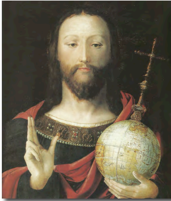
Fig. 13- Anónimo, Cristo con el globo del mundo . Siglo XVI, Berlín, Deutsches Historisches Museum.