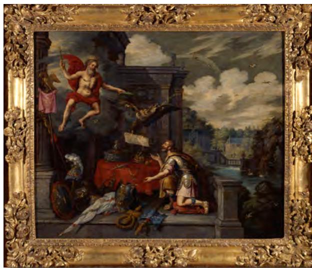
Fig. 1- Ambrosius Francken, Alegoría de la coronación de Fernando II el 9 de septiembre de 1619 . Hacia 1620, Berlín, Deutsches Historisches Museum.