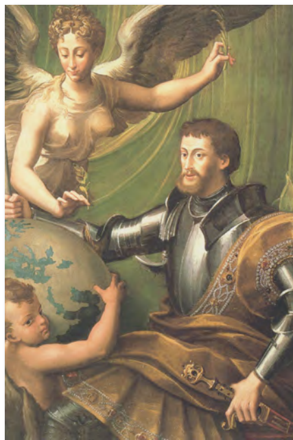
Fig. 4- Parmigianino, Retrato alegórico de Carlos V . 1529-30, Nueva York, Ronseberg & Stiebel.