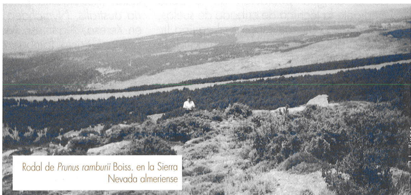
Rodal de Prunus ramburii Boiss. en la Sierra Nevada almeriense