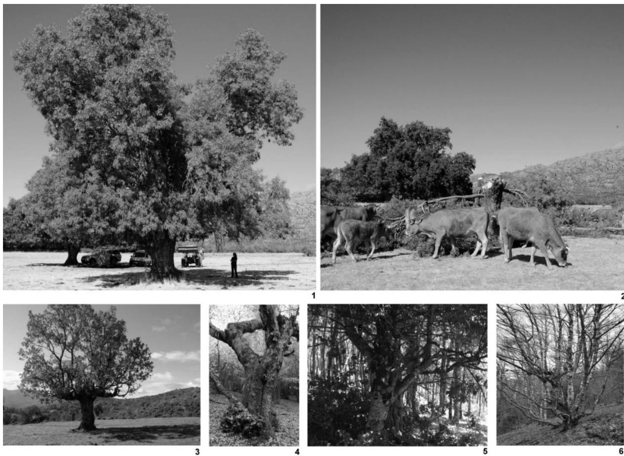
Figura 1. Descabezado (1 y 2) de un fresno en Prado Herrero (agosto 2012, Manzanares el Real); Pendolero de Quercus pyrenaica (3) en Bocigano; Quercus petraea subsp. petraea en La Acebeda (4). Pie desmochado de Ilex aquifolium en la Dehesa de Robregordo (5); Betula alba en Somosierra (6)